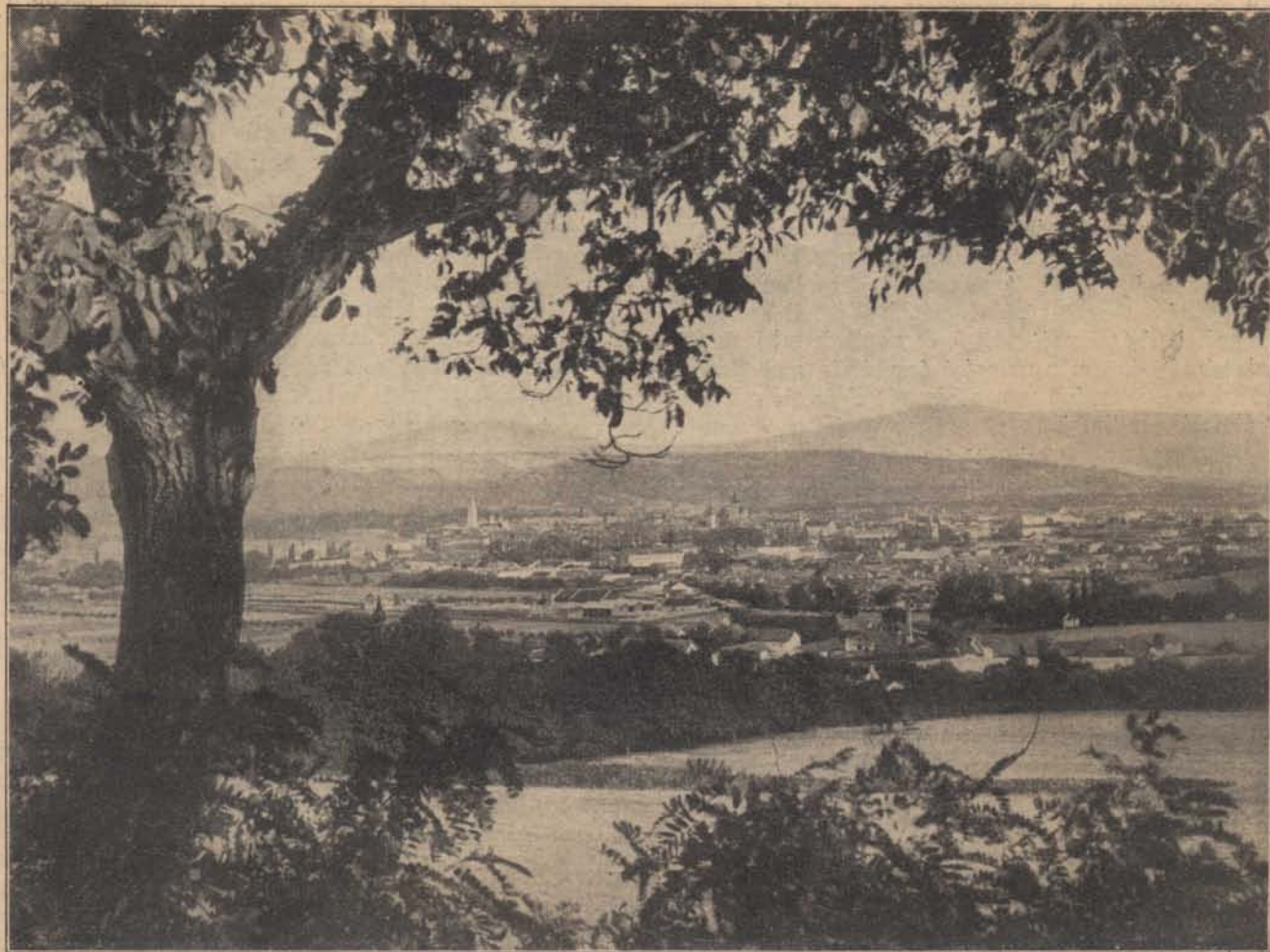
Amit vissza kell szereznünk: Kassa.