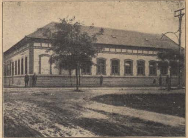
Október 16-án kezdte meg működését a pestszenterzsébeti gyalog tanalosztály is, ebben az elhelyezésben.

Ha a feltételes felfüggesztés kedvezményében részesített egyénről csak a próbaidő alatt derül ki, hogy a próbaidő előtt bűncselekményt követett el és ha e cselekmény miatt a bíróság szabadságvesztésbüntetést állapít meg, nemkülönben, ha a próbaidő alatt jut a bíróság tudomására, hogy az elítélt előzőleg már jogerősen szabadságvesztésbüntetésre volt elítélve és azt még végre kell hajtani: összbüntetés kiszabásának van helye. Az ekként megállapított összbüntetés azonban szintén felfüggeszthető akkor, ha annak tartama a három hónapi fogházat vagy az egy hónapi elzárást meg nem haladja, feltételezve természetesen, hogy az elítélt a cselekményt nem aljas indokból követte el.