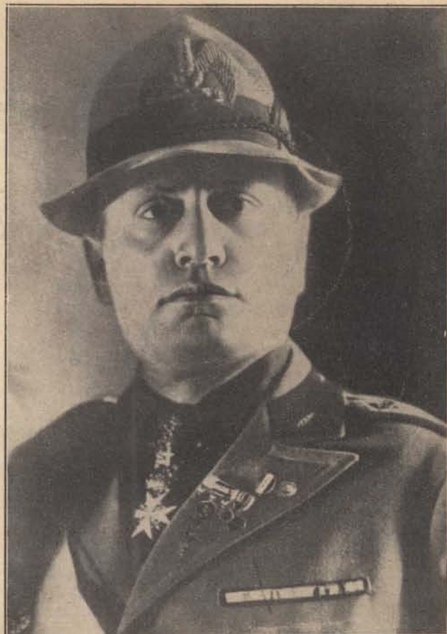
Leírhatatlan lelkesedéssel ünnepli az olasz nemzet a fasizmus 10. évfordulóján Mussolinét, aki tudomására adta a világnak, hogy ebben az évszázadban megint a régi római szellem s annak nyomán a fasizmus lesz az emberiség vezető eszméje.

d) Meg kell emlékezni végül még egy körülményről, ami a sajtó nyilvánosságától való idegenkedésünket okozta és részben indokolta s ez: katonai szervezetünk. A katonának természetében van, hogy húzódozik a nyilvánosságtól, hogy a maga szolgálati ügyeit még akkor is szereti bizalmasan kezelni és intézni, ha nem kimondottan bizalmas természetűek, hogy mindenki ismeretlen szemben bizalmatlan, egyszóval, hogy nem szívesen áll a közérdeklődésnek abba a középpontjába, amit az ujság jelent. Ebből a szempontból a polgári szervezetű rendőrség kétségtelenül előnyben volt és van velünk szemben, mert nem feszélyezik olyan katonai szempontok, amelyek minket nemcsak szorosan vett katonai működésünkben, de a közbiztonság szolgálatában is kötnek. — Katonai szervezetségünk ma is változatlanul megmaradt ugyan, de kibővült azzal a tapasztalattal, amit egyébként a háború világhírű hadvezérei is sokszor leszögeztek már, hogy minden dolognak egyedül és kizárólag csak katonai szempontból való felfogása és megítélése ma már nemcsak lehetetlen, de éppen a katonai érdekek szempontjából nem