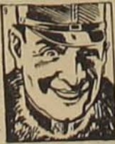
Felvidul az arc...