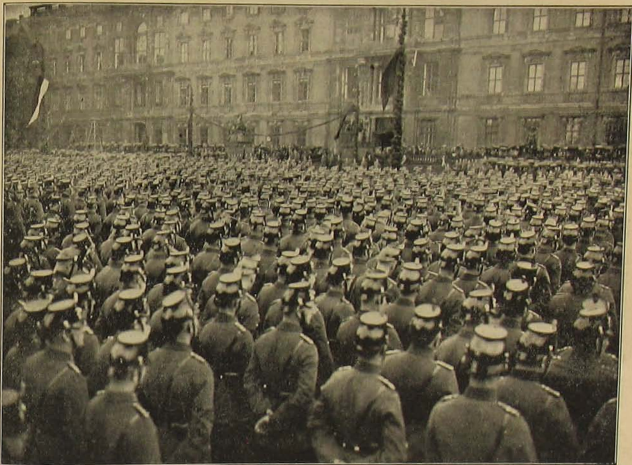
Német rondőrök gyászilnnepeje az utcai harcokban elesett bajtársak emlékére.

tani sem nem tudják, sem nem akarják s ahol minden magasabb erkölcsi felfogásra egyszerűen fútyúlnak — ebben a körben legalább tartsanak, mondjuk: féljenek tőlünk. Nevezzük ezt rettegettségnek is, mindegy. A lényeg az, hogy a tekintélynek 1918-ban kirúgták a lába alól a székét s még nagyon sokáig kell várjunk arra az időre, amikor a nemes értelemben vett tekintély elegendő lesz arra, hogy a dolgok rendben menjenek.