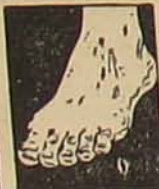
Megszűnnek a lábajdalmak...

Bizó. Írótségi feltétlenül kell, de van ennél magasabb képesítési jelentékező is. Ne foglalkozzék a gondolattal, mert nem valósítható meg.