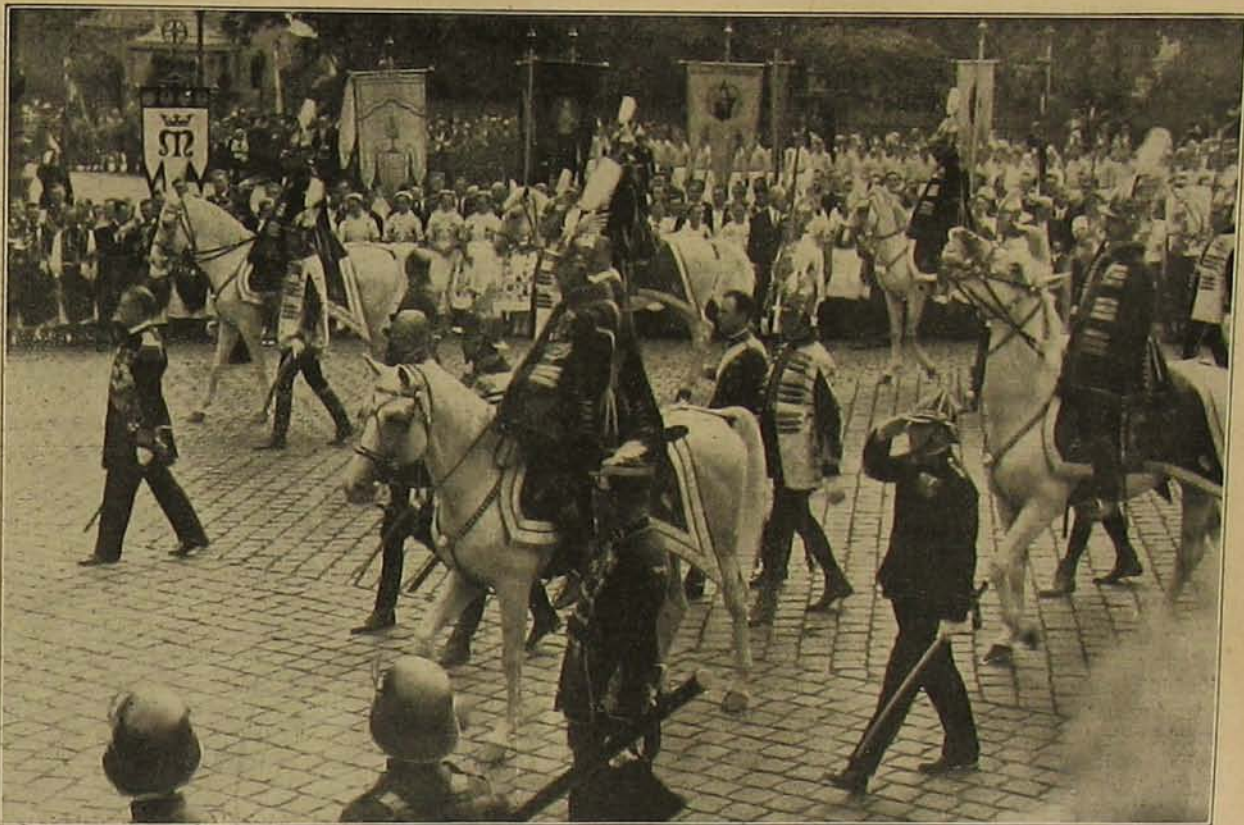
Kormányzó úr Öfőméltósága a Szent István-napi körmenetben.

kalú csendőr újszerű a csendőrség 53 esztendő történetében. Nem látszik meg rajta. Mikor pedig Gödöllőre bértünk s mikor alkalmunk volt néhány tucat ilyen fehér karmantyús bajtársunk munkáját elnézegetni, méltán hittünk volna, hogy ezeket a csendőröket külön közlekedési tanfolyamokon képezték ki.