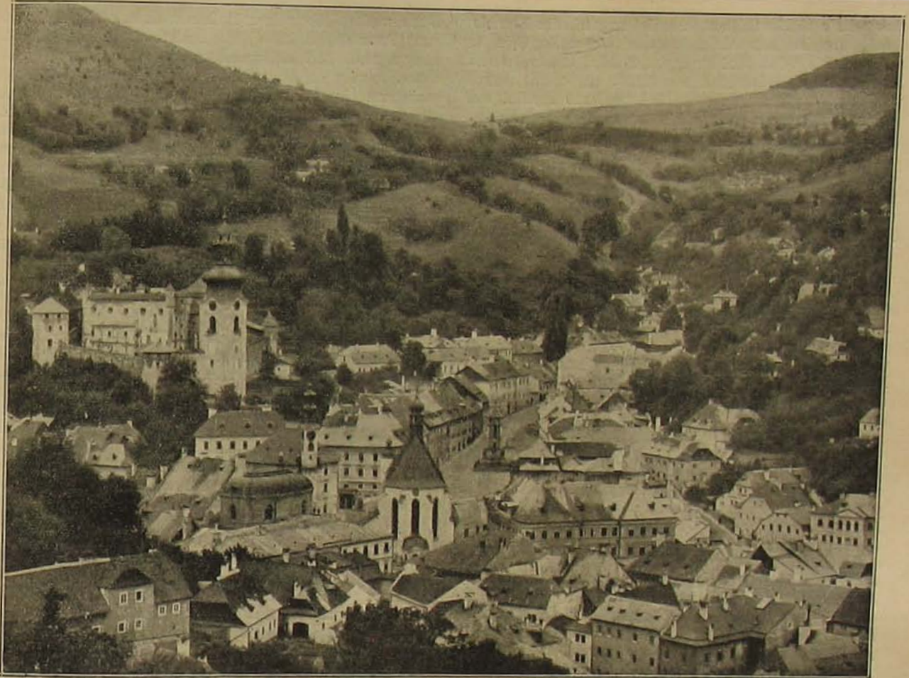
Amit vissza kell szerezniünk: Selmecbánya.