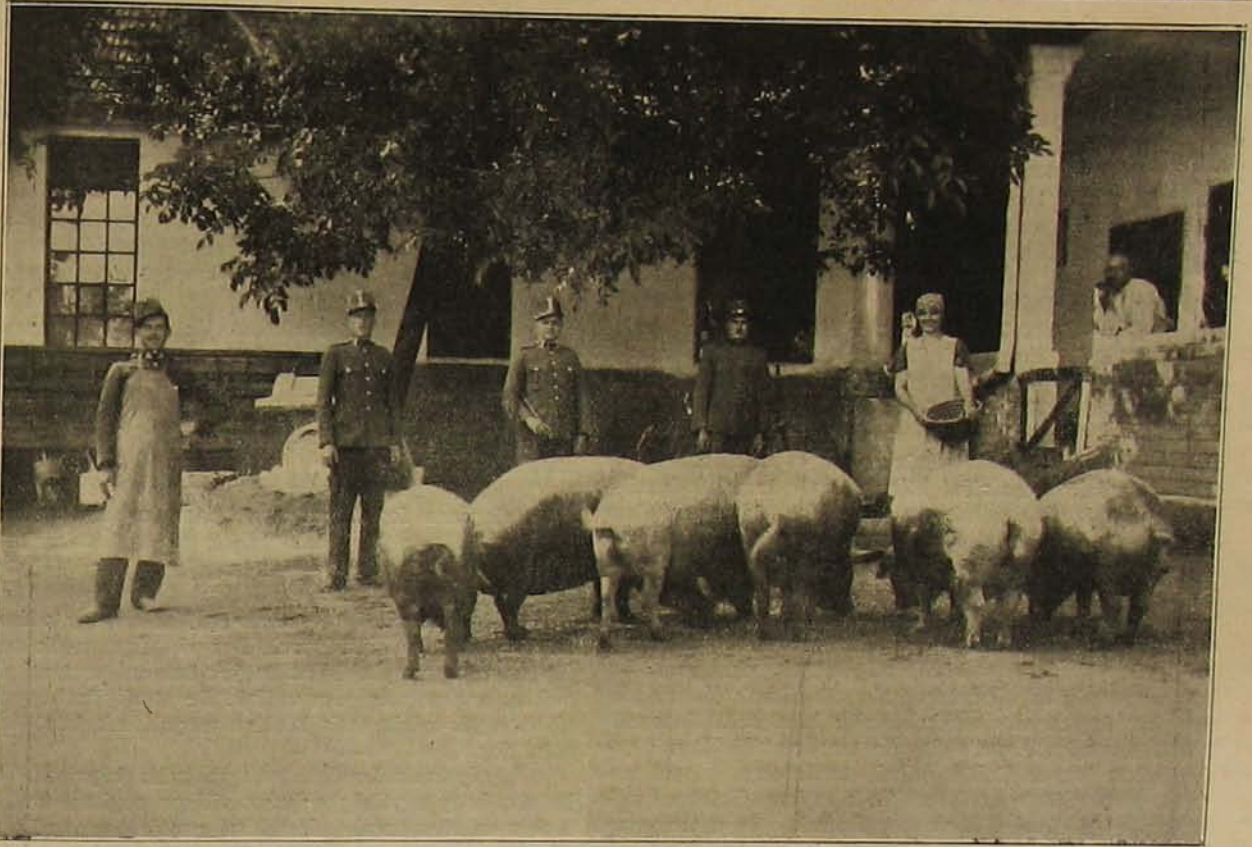
Lapunk 15. számában felvételt közöltünk a dömsödi örs szép yorkshirei tenyészetéről. Mint e képünkön látható, a bicskei örs közzgazdálkodása sem marad mögötte — mangalicában.

kialakul egy olyan terv, mely Magyarország helyzetén is javít. Ez alatt a javítás alatt mi nem érthetünk, nem is értünk mást, mint területi revíziót, mert Magyarország minden bajának legelső oka az, hogy megcsönkítetták, következképpen annak, aki rajtunk segíteni akar, e szörnyű igazságtalanság jóvátevésén kell kezdenie.