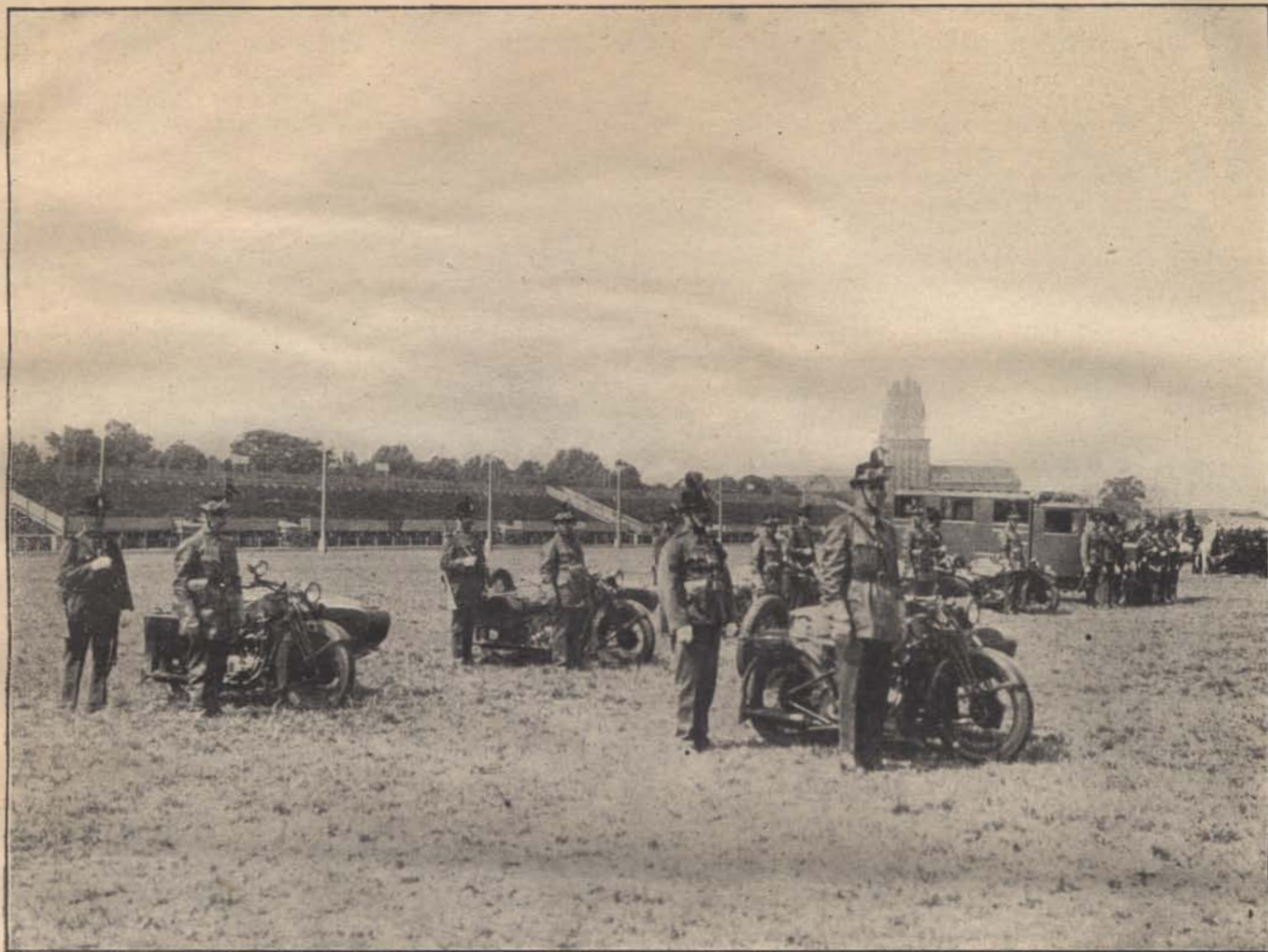
A csendőrség kivonulása Budapesten Fey Emil osztrák közbiztonsági miniszter tiszteletére: Motoros osztag és helyszínelő gépkocsi.

mindenki vigyáz, arra senki sem vigyáz. A fogolyőrzésre kivezényelt csendőr szereljen fel és teljesítse feladatát lelkiismeretesen; ne bízzék abban, hogy hiszen úgyis ott vannak a bizalmiügyének is, azok majd szemmel tartják a foglyot vagy foglyokat, ő pedig ráhajtja az asztalra a fejét és szunyókál. Ha a fogoly megszökik, nem a bizalmi egyént, hanem a csendőrt vonják felelősségre. Ne bízsa el tehát magát, hanem legyen éber, mert a fogolyőrzés unalmas szolgálat, az ember könnyen elszunyókál s mire felébred, a fogolynak híre-hamva. Mert, hogy a bizalmiügyének az első félórában elalszanak, az holtbizonyos, mert tudják, hogy nem felelősek semmiért. Éppen az ilyen esetőségekre való tekintettel, a fogolyőrzésre kivezényelt csendőrt a parancsnoknak időnként ellenőriznie kell, ezáltal a fogolyőrzeti szolgálat unalmasságát csökkenti, de biztosabbá is teszi. Az ellenőrzés által saját magát is biztosítja, mert ha a fogoly megszökik, rendszerint nem csak a fogolyőrizetre vezényelt csendőr, hanem a parancsnok, sőt az egész őrs is megissza a levét.