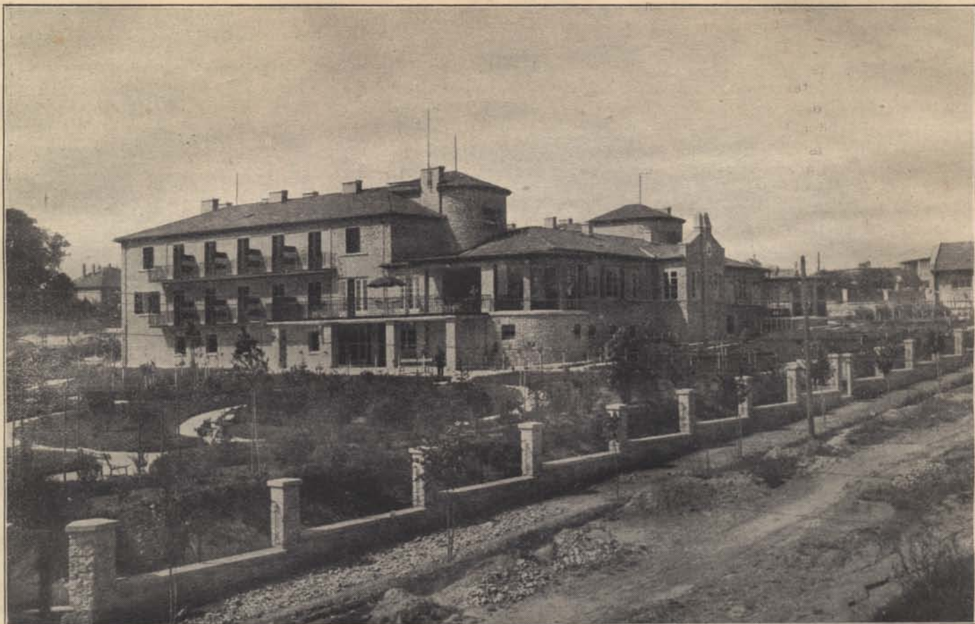
Az új hévízi „Horthy Miklós” csendőrségi gyógyház keleti oldala (tishti szárny).

érdekeinek megfelel. Ennek a lelkiismeretes, fáradságos gondosságnak a nyoma meglátszik a gyógyház minden porcikáján az utolsó szegig és fűszálig.