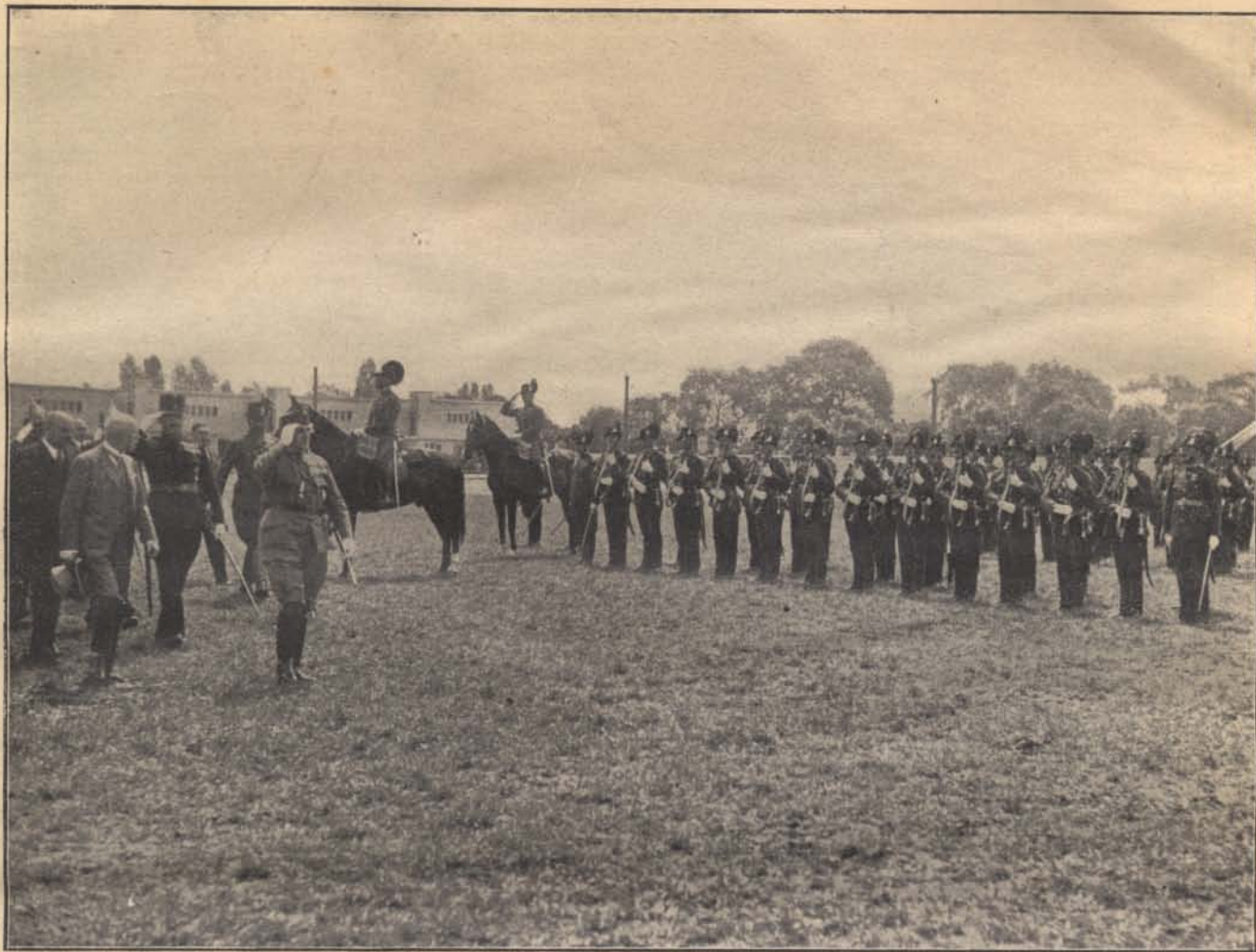
Fey Emil osztrák közbiztonsági miniszter június 13-án meglátogatta Budapesten a magyar belügyminisztert. Ez alkalmából a csendőrség és a rendőrség Budapesten a Tattersalban nagyszabású kivonulást rendezett. Fey miniszter dr. vitéz Keresztes-Fischer belügyminiszter kíséretében ellép a csendőr gyalogszázad előtt.

csendőrség a fogoly kísérésénél, őrizeténél vagy őrizetbevitelénél.