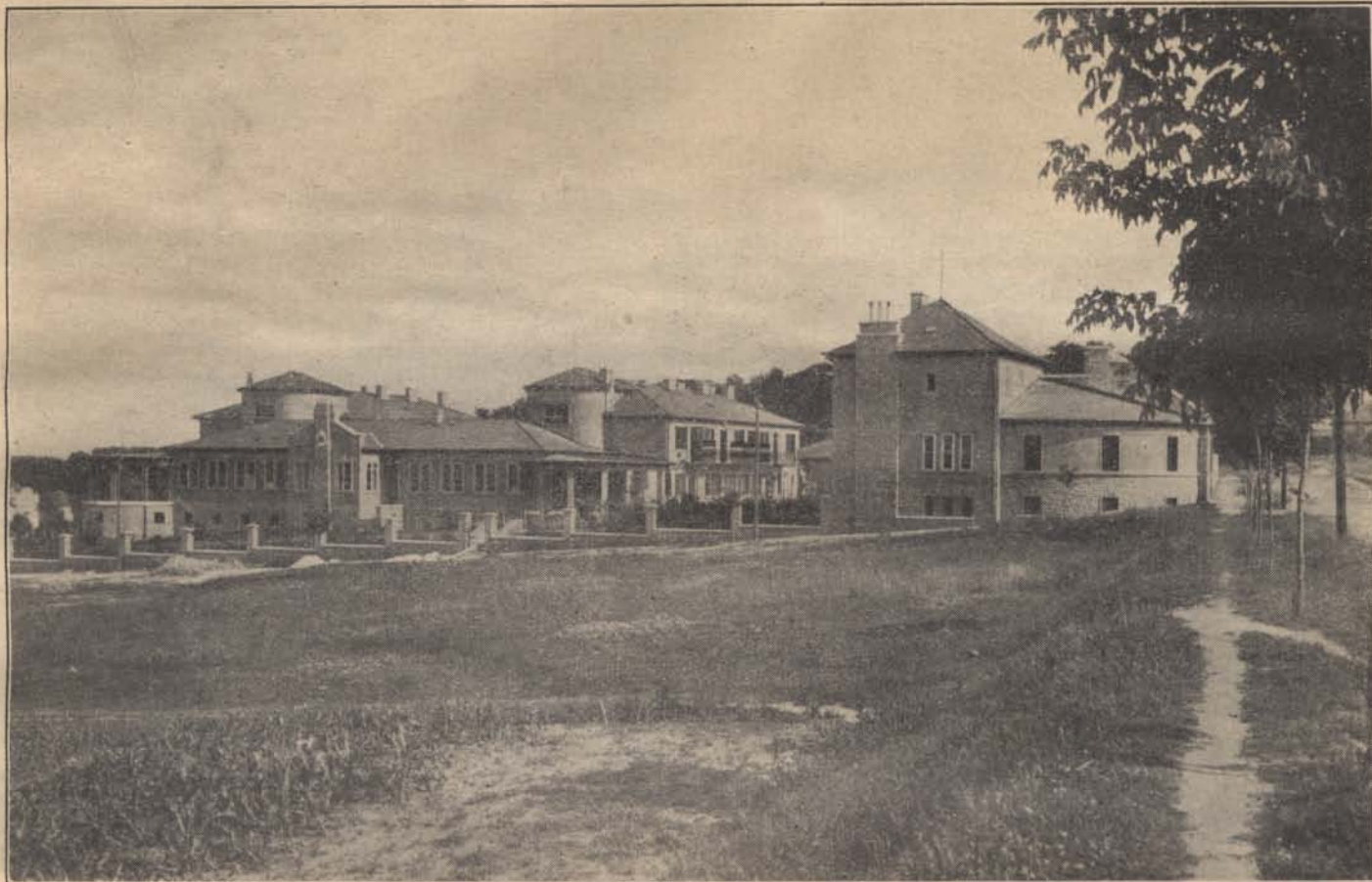
Az új hévízi csendőrségi gyógyház nyugati oldala (altiszti szárny). A jobbra levő épület az új örszlaktanya.