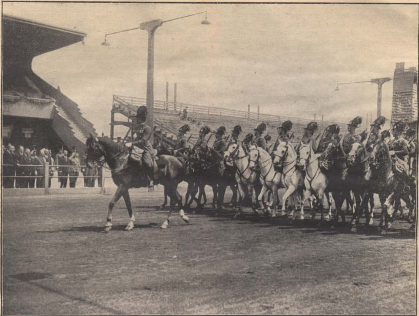
A csendőrség kivonulása Budapesten Fey Emil osztrák kö. biztonsági miniszter tiszteletére: A budapesti lovasalosztály díszmenete.

mit csinálnak foglyaim. Felöltöztem és kimentem megnézni. A helyiség ajtaját kinyitottam a nálam volt kulccsal s midőn beléptem, majd hanyattvágódtam a meglepetéstől. Mindenki horkolt, de olyan mélyen, hogy az ajtónyitásra sem ébredtek fel, csak az egyik fogoly (a veszélyesebbik) volt ébren, felülve. Hogy min törhette a fejét, nem tudom, csak gondolom. Az járhatott eszébe, mi módon lehetne a kedvező alkalmat szökésre kihasználni. Nekem ugyan nagy viccesen azt mondta, hogy na, tiszthelyettes úr, ha akartam volna szökni, ma már bottal üthetnék a nyomomat, de azt hiszem, ha még egy órát kések, már hült helyét találok.