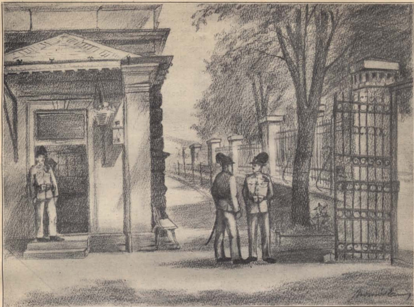
Kapuügyelet a budapesti csendőrlaktanyában.