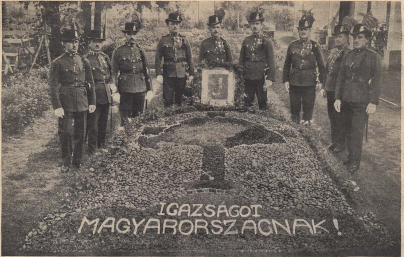
Tápiószelei őr s legénysége kőből és üvegből kirakta keresztrefeszített Csonkaországunkat „Igazságot Magyarországnak!” felirattal. Szép munkájuk követésre méltó.

érzésem, hogy a következő pillanatban úgy mázolja falhoz ezt a kis piaci legyet, hogy folt sem válik belőle.