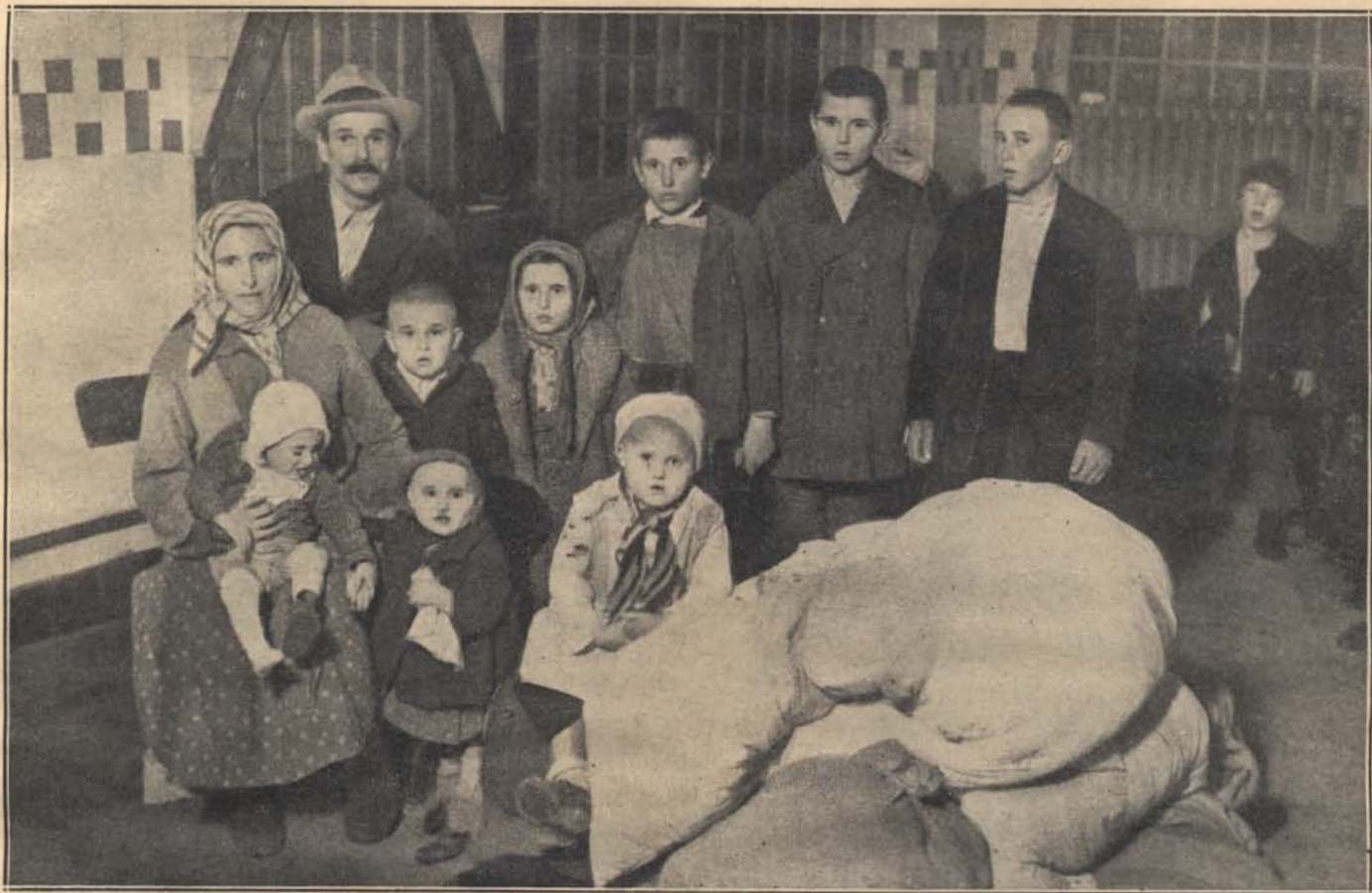
A szerbek 3000 magyart utasítottak ki, köztük ezt a népes családot is. Minden vagyonuk, amit magukkal hozhattak, hever.