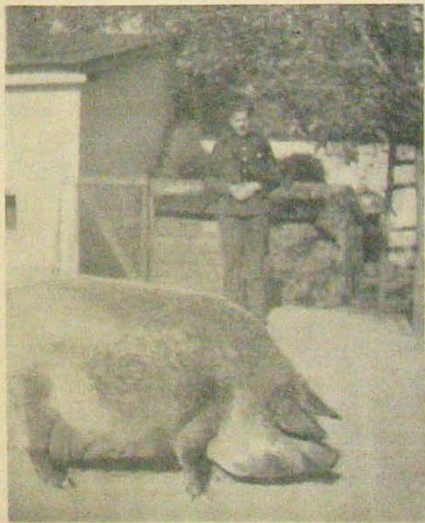
A kúbbajai kögazdálkodás 320 kg-os hízója.