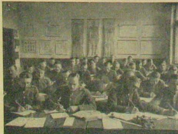
Mindenki a maga dolgát...

1929-et írtak akkor. Kint hóvihár sepepte végig a tájat, a kályha csövében ijesztően tombolt a szél. A legénységi szobában ketten voltunk otthon karácsony szent estéjén: az őrsparancsnokhelyettes és én. A többiek szolgálatban voltak. Kikérkedtem a községbe, hogy a szent estét menyasszonyom társaságában tölthessem.