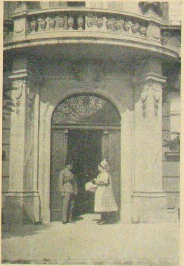
A salgótarjáni gy. tanácsostály kapujában.

Csupán az vigasztalt, hogy először voltam járőrvezető a vasútgyeletekben, erre kicsit büszke voltam. Nem is bújtam volna el az idő elől, még akkor sem, ha még egyszer olyan hideg lett volna. Azt azonban sajnáltam, hogy ezt az önálló szereplésemet nem látja senki, csupán az öreg bakter, de az meg észre sem veit.