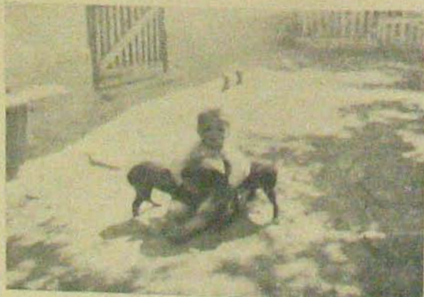
Három jobará.