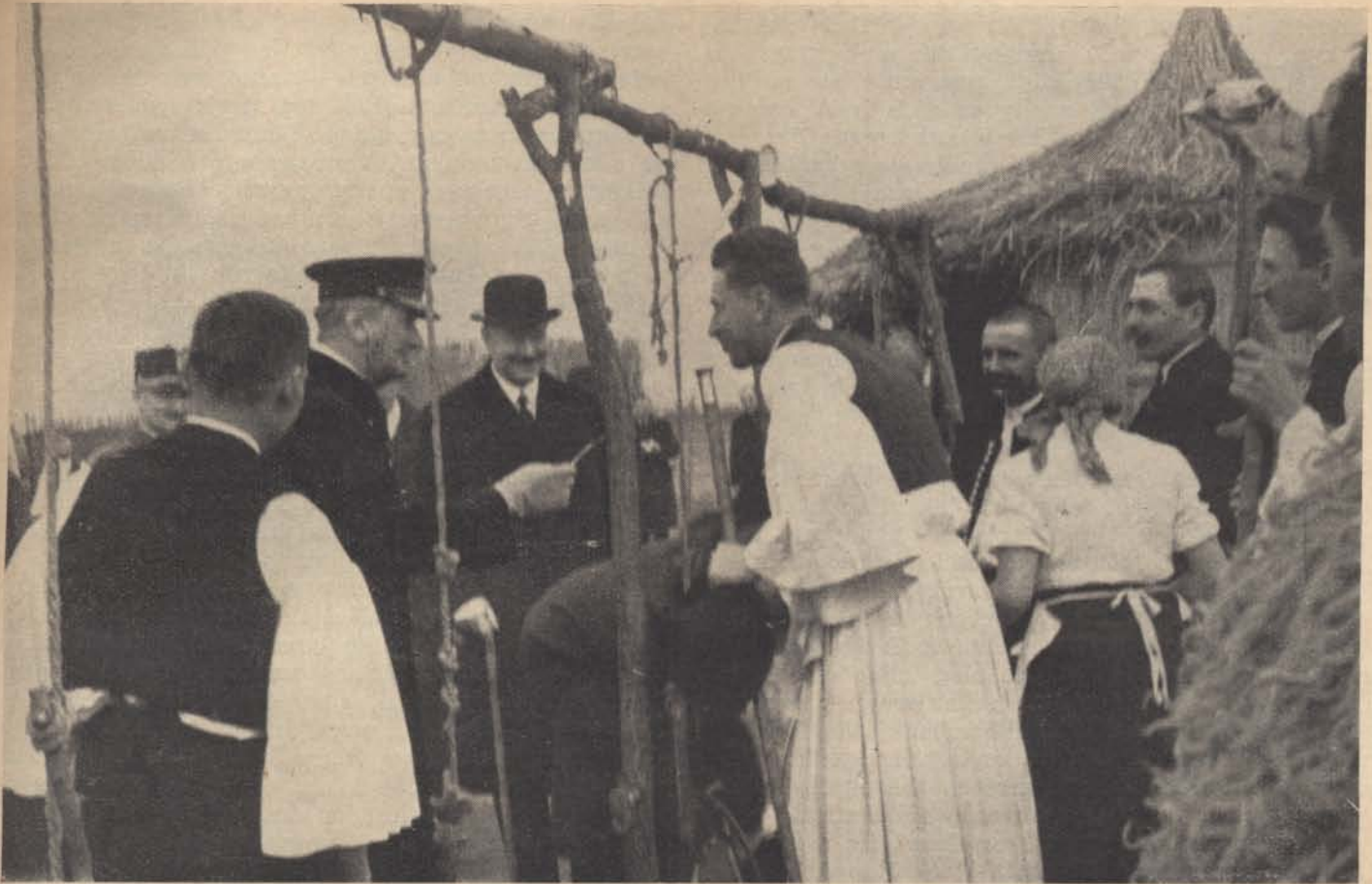
Kormányzó Úr Ó Főméltósága Darányi Kálmán miniszterelnökkel a mezőgazdasági kiállítás juhásznepe között.

együtt kiszednek. Rendszerint vékony, finom fonálból készül, hogy a halak észre ne vegyék. Nagyobb vizeinken, kivált a Balatonon, különösképpen sok süllőt fognak ki az orvhalászok ezzel a hálófajtaival. A merítőhálót kisebb-nagyobb négyszögletes ke-retre erősítik fel s egy megfelelő hosszúságú rúd segítségével a vízfenékre lebocsátva, a rúd segítségével időközönként kiemelik a benne lévő halakkal együtt.