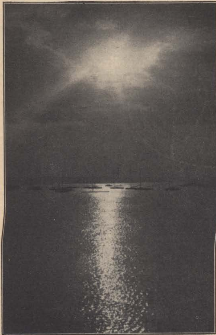
Alvó vitorlások...

A kérvények bélyegmentesek, de a gyógykezelési céllal benyújtott kérvényhez 1 pengős okmánybélyeggel ellátott