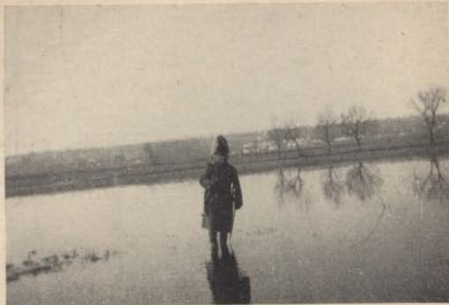
Tessék itt portyázni...