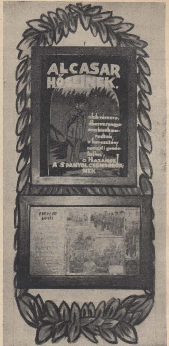
Annakidején írtunk a spanyol nemzeti csapatok oldalán küzdő és az ostromlott Aleazarban hőiesen harcoló spanyol esendőrökről. A nyíregyházi gy. tanalosztály ezzel az emlékfalal örökítette meg ezeket, a világ esendőreinek példát mutató hőstetteket.

h) A fulladásos halál is sok esetben szerepel elsődleges halálként. Olyan sérülések, amelyek egyszerre megnyitják mind a két mellkast, fulladás