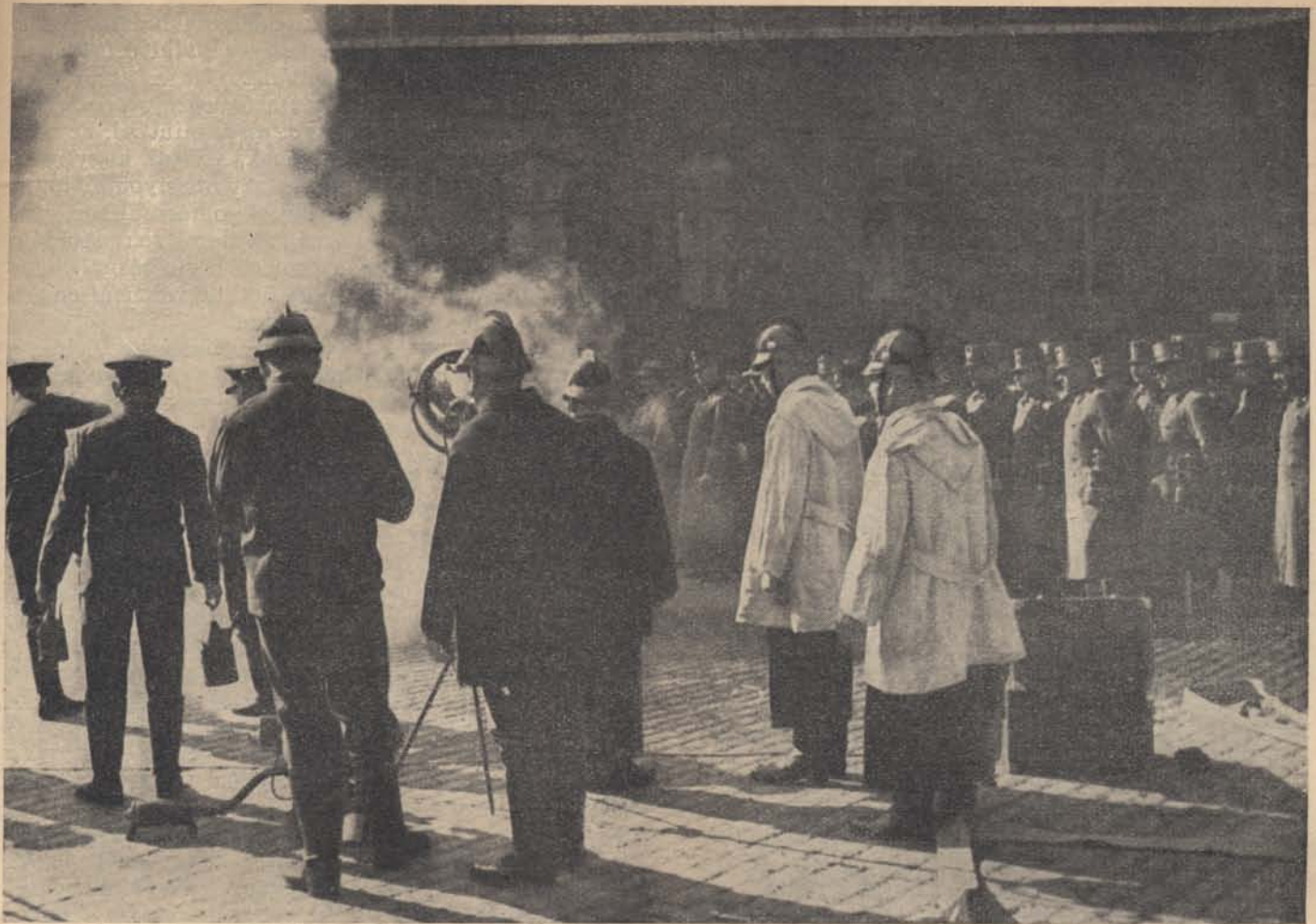
A fővárosi tűzoltóság egyik gyakorlatát a csendőrség tagjai is megtekintették.

Ebből a kis összeállításból is látni lehet, milyen gyakori a mérgezések gyanúja akkor, amikor valaki hirtelen rosszul lesz és meghal.