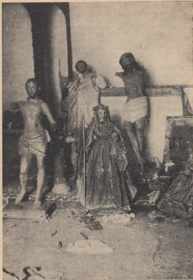
A véres spanyol földről: Megcsónkított templomi szobrok és feszület.

Hangsúlyozzuk azonban, hogy ez a véleményünk csak a kérdésben felvetett esetre vonatkozik, amikor t. i. az orrvadász a lövés után azonnal elmenekül. Ha nem menekül, hanem olyan magatartást tanúsít, amelyből a járőr további támadó szándékra következtethet, e magatartása már további támadással való veszélyes fenyegetésnek tekinthető, vele szemben tehát a fegyverhasználat az általános szabályok szerint jogosult.