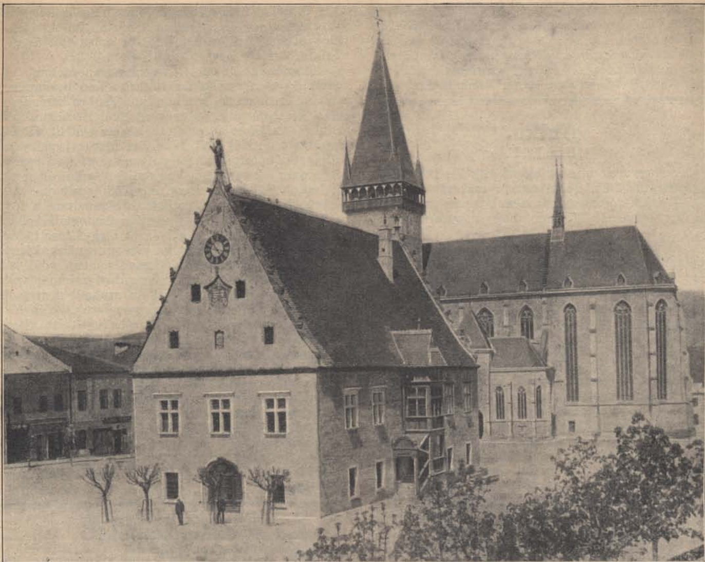
Amit vissza kell szereznünk; Bártfa.

ütköző. Vonat érkezett Erdélyből. Hallucináló és mindig féltő utasok kocsijuk ajtaján kitekintgetnek. Meglátják a magyar lobogót s a magyar csendőrt a pályaudvaron. Amit Simeon érzett Jézus láttára, akiben az eljövendő Megváltót érezte, azt érzik és mondják is: „...látták a szemeim az Üdvözítőt...”. S didergő hidegben némelyek a zászló, mások a csendőr köré gyűlnek, vagy nézik szeretettel és könnybe-lábadó szemmel és jóreménységekkel a távolból. Egy-egy jó szót is szólnak hozzá és leirhatatlan boldogságot éreznek. A magyar csendőr a Csonkahaza határán: a békebeli Nyugat-európát, az otthoni biztonságot jelenti.