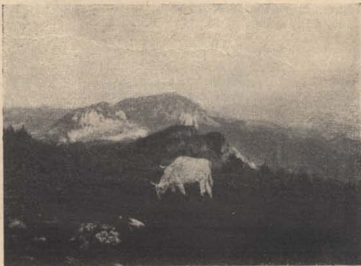
Erdélyből: Havasi legelő.

Sógorok voltak. Földik voltak. Mindketten az alföldi puszták forró ugarából szívták magukba a magyar földhöz való ragaszkodás szent érzelmeit. Apám ekkor testben és lélekben összetört beteg,