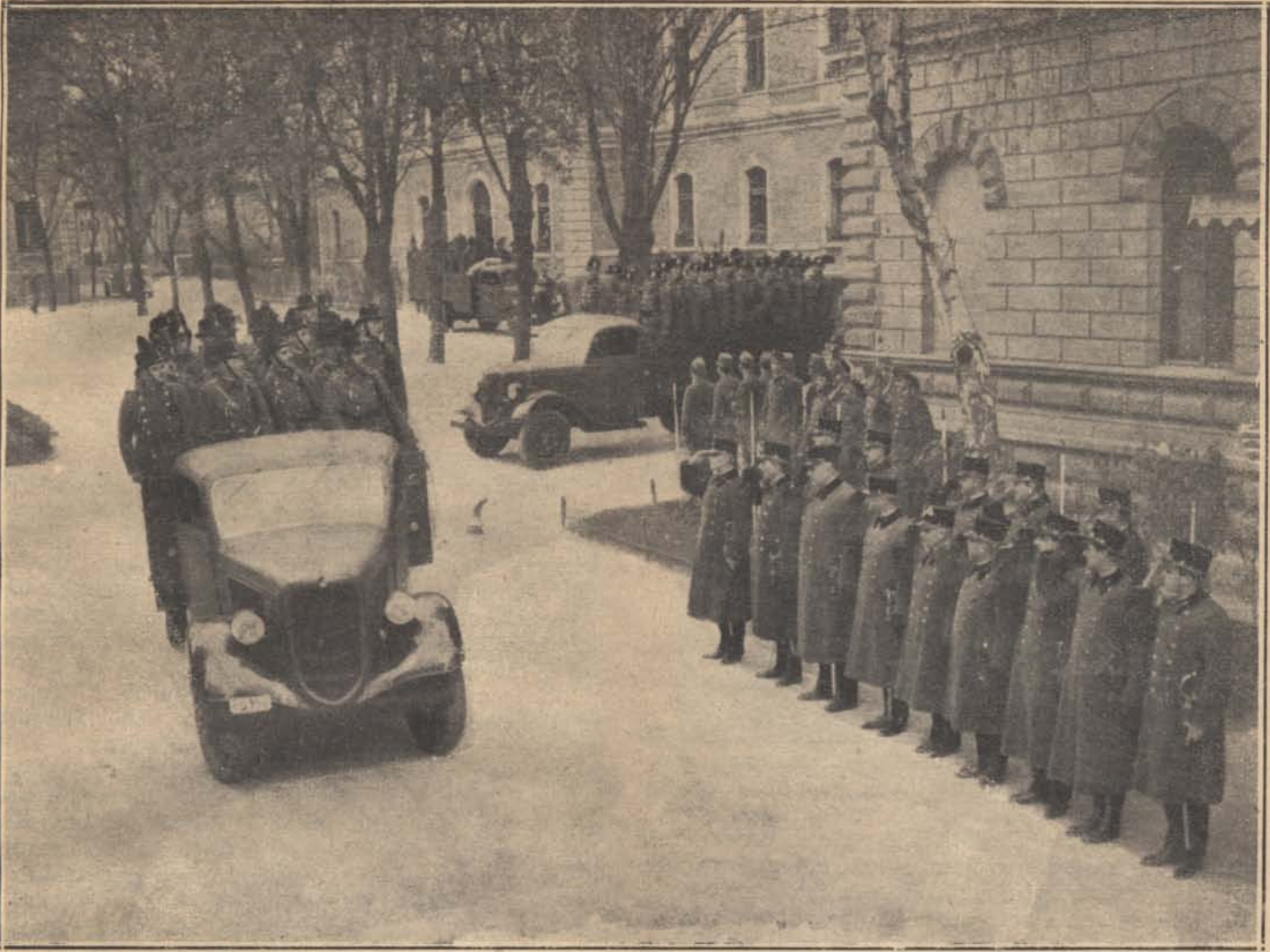
A Budapesten összpontosított csendőrszázad elindul a határra.