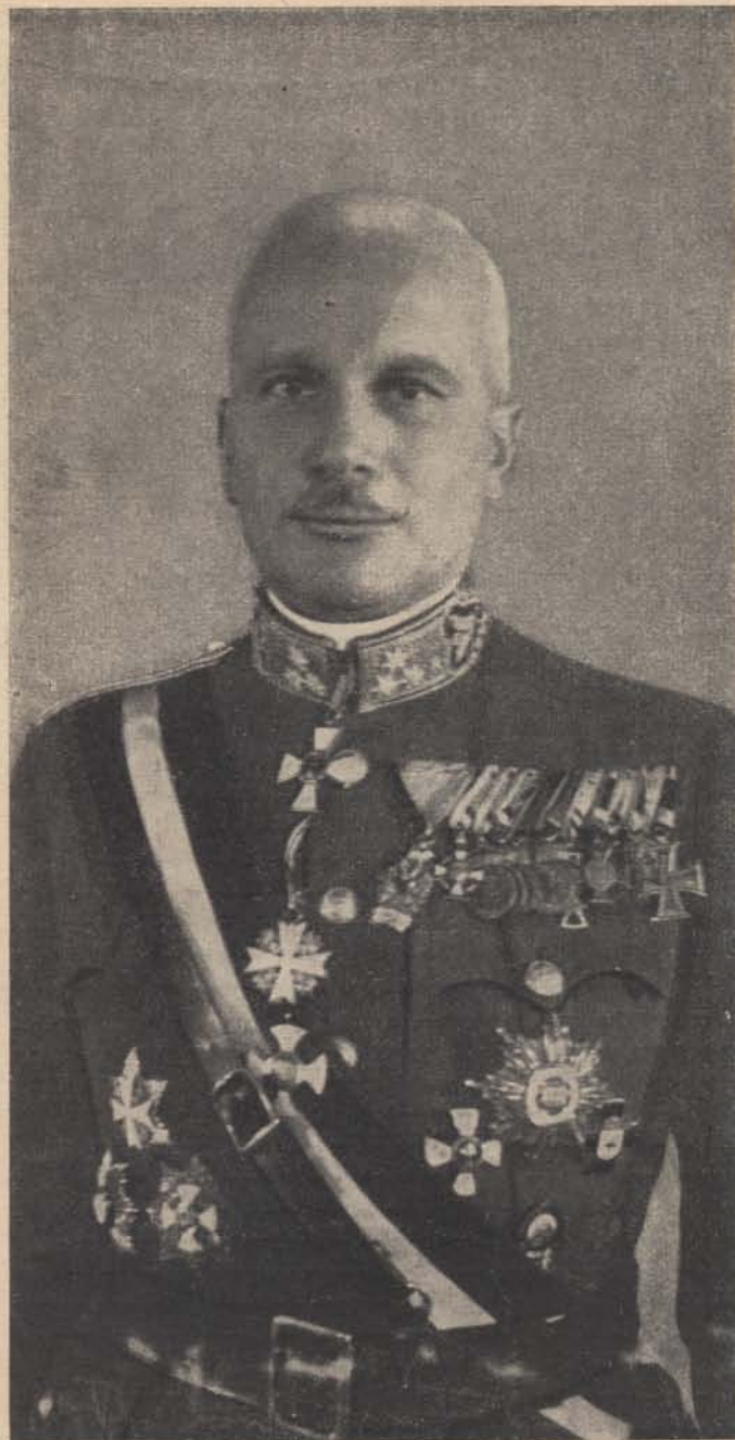
vitéz Dalnokfalvi Bartha Károly tábornagy, honvédelmi miniszter.

És mi összébbjöttünk. Új emberek... Új, fiatal