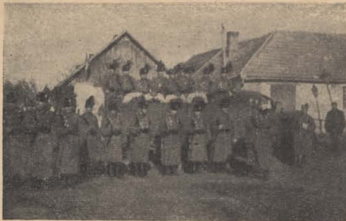
A királyhelmei és bélyi őrs a határ átlépése előtt.

— A fiamhoz mehetek!... Ungvár!... — csak ennyi és csurogtak a könnyei, neki is, meg a diáknak is