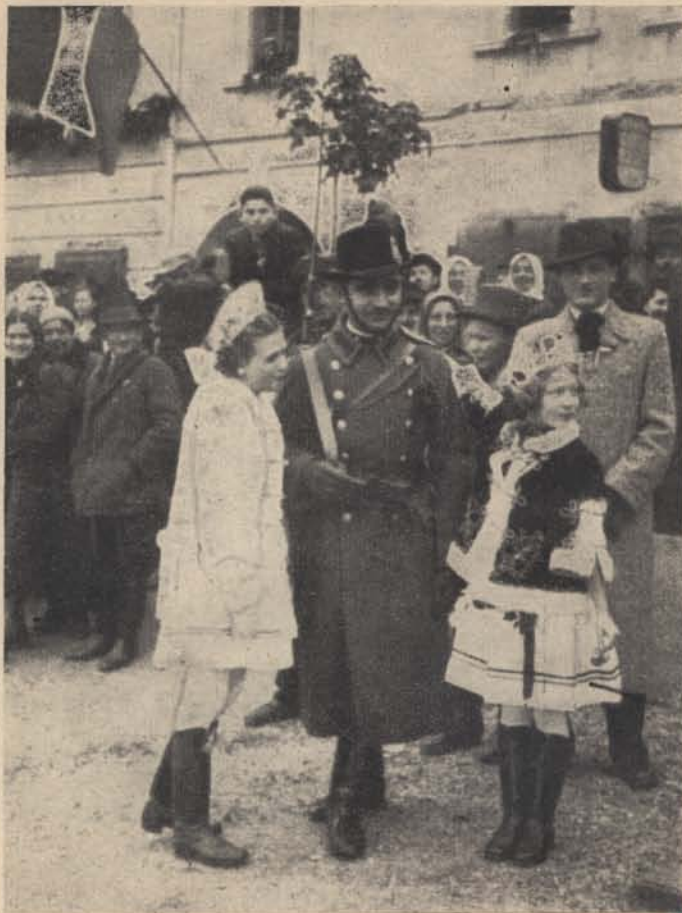
Ezek a kicsik most látták először magyar csendőrt.