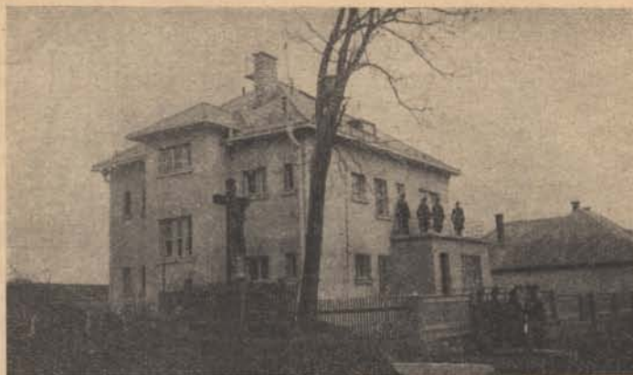
A csábi őrs (Felvidék) laktanyája. (Turchányi István eső. felv.)

Nagyon nagy tévedés lenne tehát, ha egyik-másik bajtársunk úgy gondolkodnék, hogy ennek vagy annak a leckének a megtanulása, valamelyik terep-