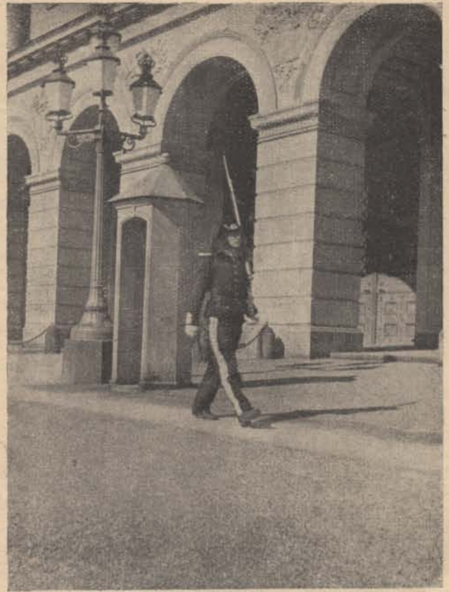
Testőr az oslói kir. palota előtt. (v. Liptay alez. felv.)

Körülbelül hat hónap múlva az egyik vendéglő elől egy kerékpárt loptak el. Mivel állandó helyiügyeleti szolgálatot teljesített az őrs, az őrsparancsnok a helyi járőrt bízta meg a kerékpárlopás nyomozásával. 3 napig a nyomozás eredménytelenül folyt. A lopás utáni 4-ik napon én kerültem, mint jv. helyi szolgálatba és az őrsparancsnok nekem is meghagyta, hogy a kerékpárlopás ügyében én is nyomozzak. Az előző járőröknek a vendéglős, ahonnan a kerékpárt ellopták, megadott egy személyleírást egy egyénről, aki éppen a lopás idejében távoztat el a ven-