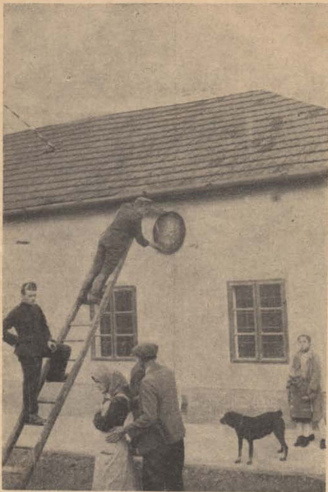
1938 nov. 8.-án a zselizi csendőrlaktanyára visszakerült a 20 évig rejtegetett címtábla...