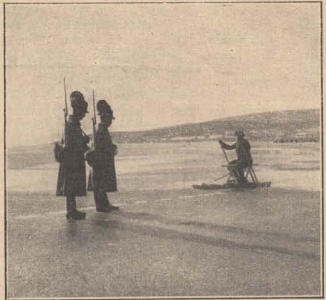
Fakutyázás a Balatonon.