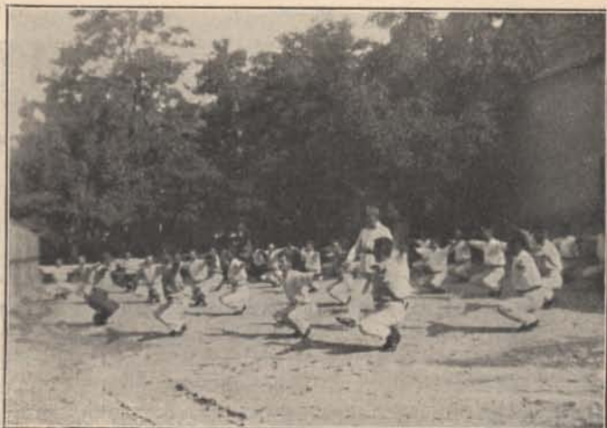
Reggeli torna az iskolában.

A Seeadler kereskedelmi háborúja már 8 hete tartott. Eddig 40.000 tonna hajóürt süllyesztett el.