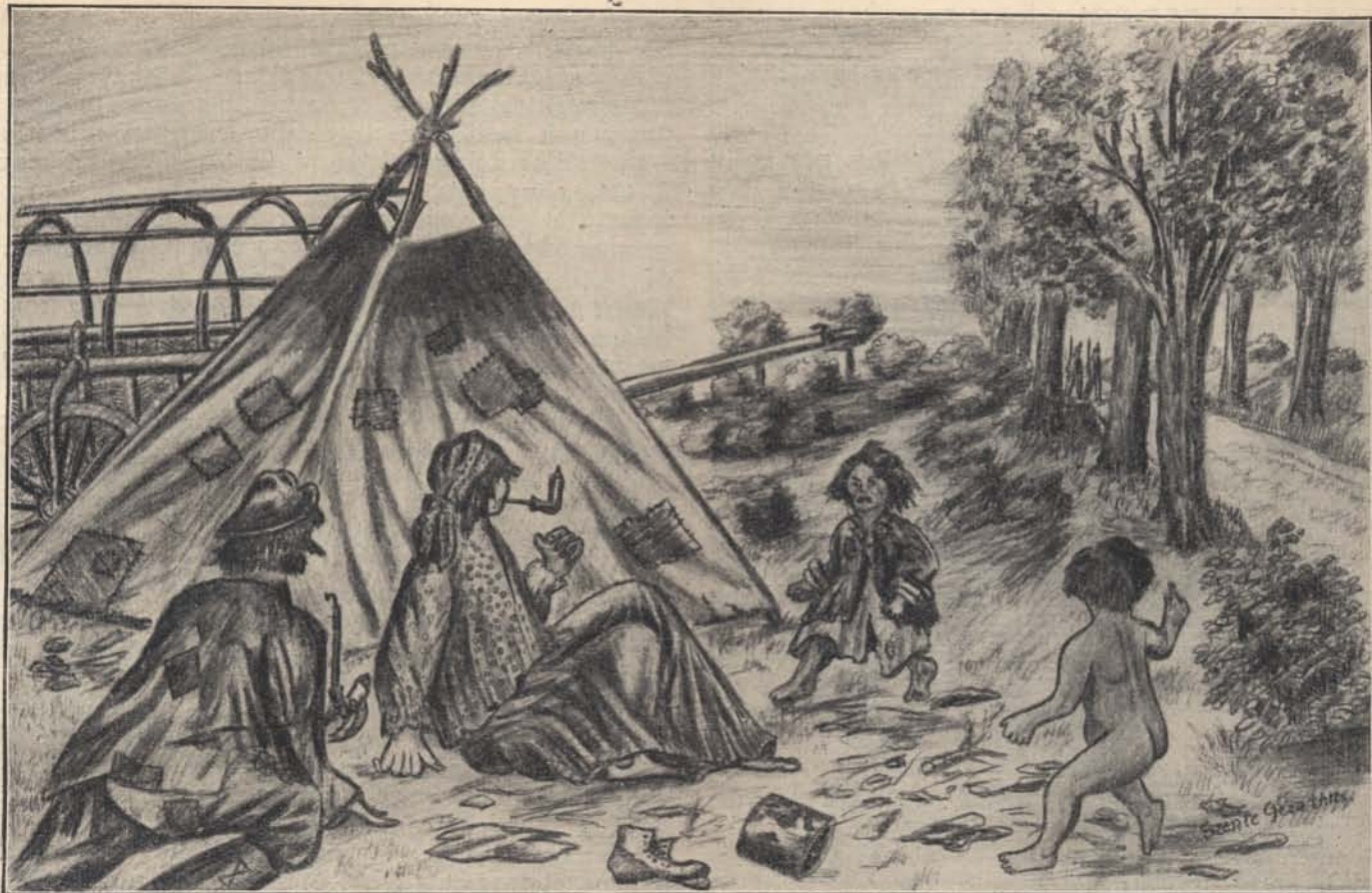
Rajzpályázatunkból. Gyínnék á csendérek . . .