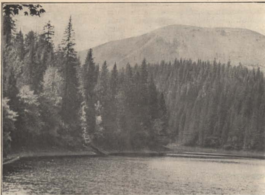
Kárpátaljáról: Tengerszem Szinevérnél.