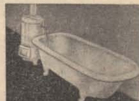
Vízvezeték nélkül — Szerelés nélkül.