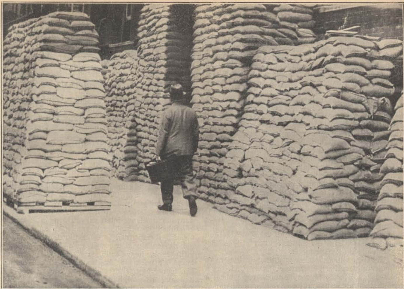
Homokzsák-torlaszok védik az értékesebb épületeket a repülők bombái ellen.

nek a tudatába belecsempészte a céltalan háború gondolatát és előtérbe tolta a nemzetiségek felszabadításának vágyát az osztrák uralom alól, szünet nélkül hozzáfűzve, hogy csak forradalmakkal lehet véget vetni a cél nélkül húzódó világháborúnak. A frontokra visszatérő szabadságos katonák itthon magukba szívták a „lógás” szellemét, a hazug, ferdítő propaganda téveszméit; az orosz fogságból szabadultak egy új világrend hírével tértek haza. Az ott tanult bolsevista propaganda módszereivel egyszerre ezer és ezer propagandista magyarázta itthon és a fronton az új nagy változás és a jövő kialakulásának rózsás képét. Northcliffe ezalatt megnyerte magának gróf Károlyi Mihályt, aki az osztrákoktól való elszakadás és a nemzeti tanács hangzatos propagandájával megrajzolta a magyarság előtt is a régóta óhajtott függetlenség délibábos képeit, miközben nem akadt senki, aki átlátott volna ezen a szövevényes propaganda-pergőtűzön, hogy megállítsa a Végzetet az útjában, vagy ha meg is látta, elkésve jött javaslataival, felvilágosításaival, mert már senki sem hitt semmiben, mert megsemmisült az erkölcsi erő a monarchia népeiben és a magyar népben is az ellenséges propaganda lelkeket megmérgező hatására. Majd azután, midőn a propaganda nagy eredményeiről az ántánt tudomást szerzett, előlről is megindította — végső erejét összeszedve, — támadását. Visszaverte széthulló haderőnket. Visszaszerezte az elvesztett országokat. Sőt meg-