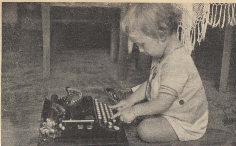
Mikor lesz még ebből feljelentés...