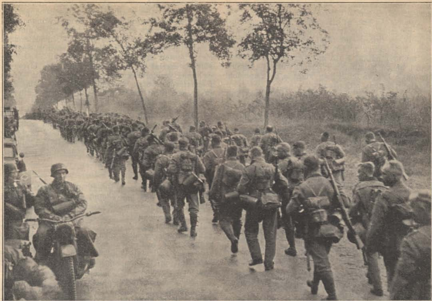
Német csapatok menetben a harctérre.