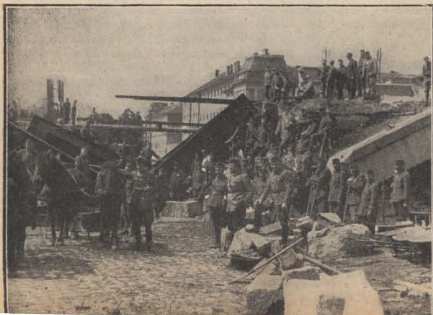
Felrobbantott vasúti felüljáró.