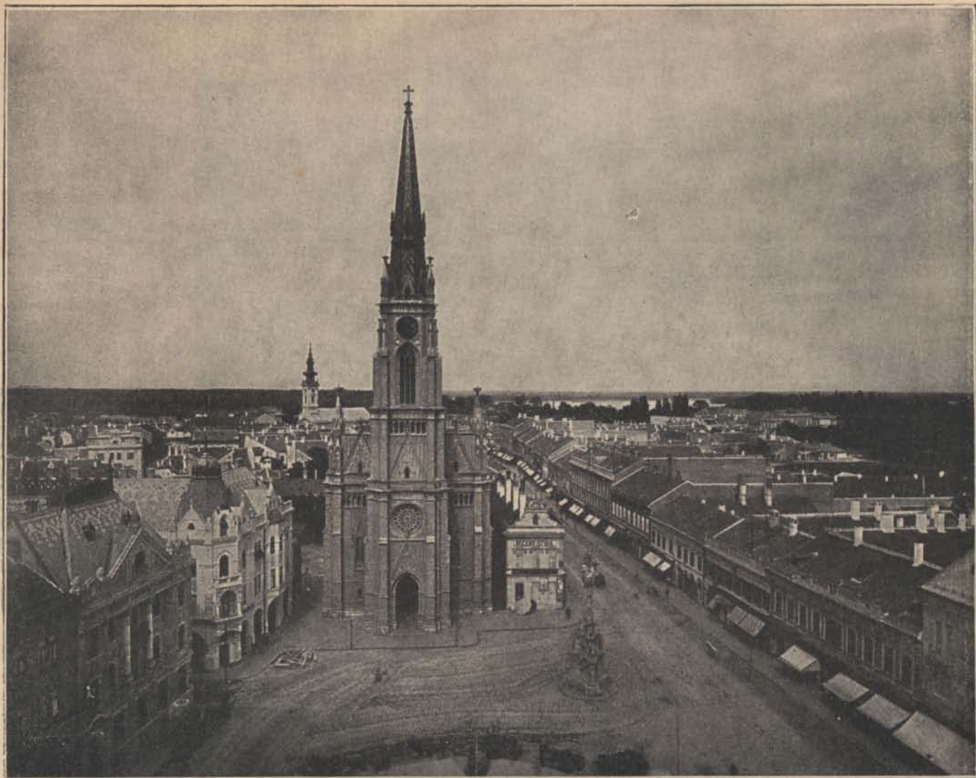
Amit vissza kellett szerezniük: Ujvidék.

sodródik a budapesti alvilágba? Ha nem lop, akkor is tagja. Semmi nem marad rajta és benne a faluból, a zavartalan magyarból. Gondolatvilága beleolvad a zsargonba, tekintetén, mozdulatain, szokásain ordít egy idegen világ ezer jele. Ez már se magyar, se német, se hottentotta, ez már egyszerűen csak — haver. Ha a kutyája beszélni tudna, megmosná a fejét. Megpirongatná és visszavezetné a föld egyszerű magyarságához megint.