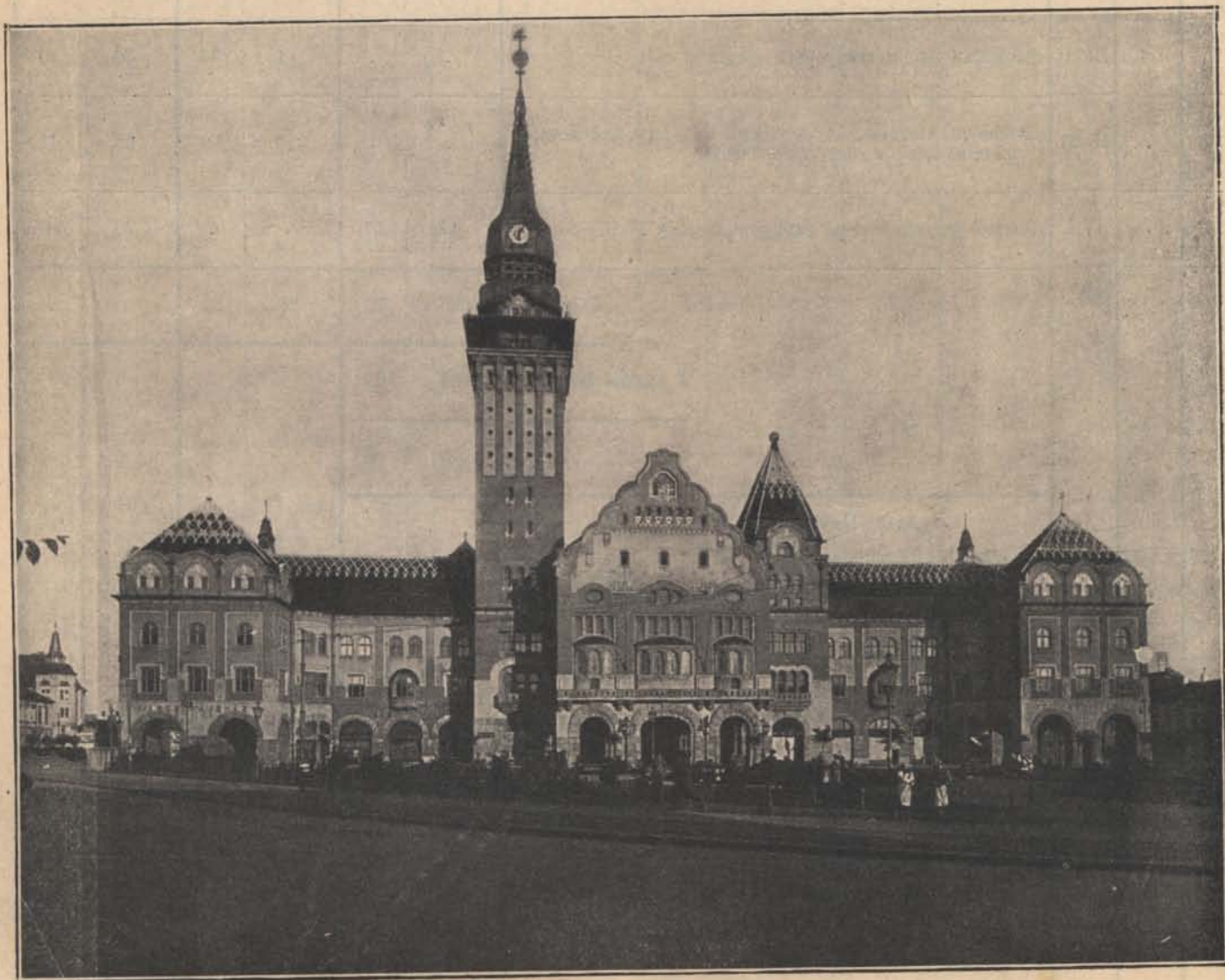
Amit vissza kellett szerezniük: Szabadka.

Jánosból és a puliból így lett — haver. Miért van az, hogy a faluról felvetődött legény így bele-