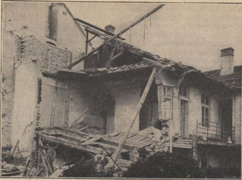
Április 7-én Szegedet jugoszláv repülők bombázták. Az 5. ny. alo. felv.

Arad tisztálkodik. Polgármesteri rendeletre egy héten át mindenki mos, mosdik és nyíratkozik. Fertőtlenítési hetet rendeznek, mint a cigánytelepen szokás.