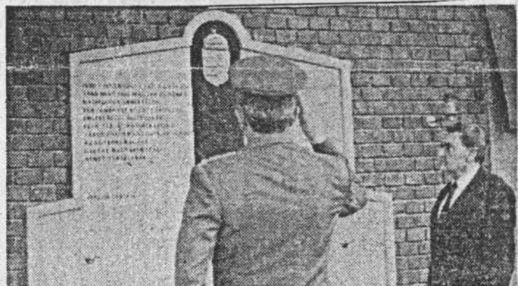
Tisztelgés a hadifoglyoknak