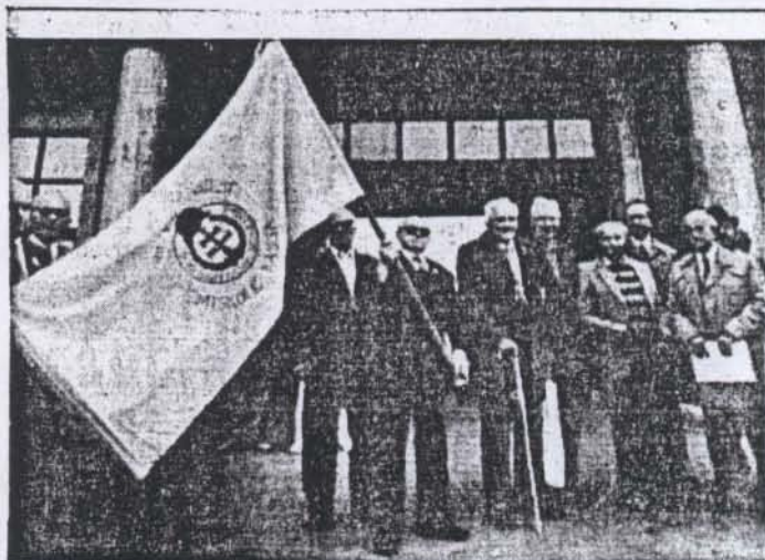
Ez a gyár már nem az a gyár (BVK) ahol ezek az emberek, és több mint ezer társuk – majd negyven éve – három keserves évig robotoltak. Tiszteletükre rendeztek tegnap kegyeleti ünnepséget Kazincbarcikán, s adott fogdást a Borsodchem. (Beszámolóink az 5. oldalon)