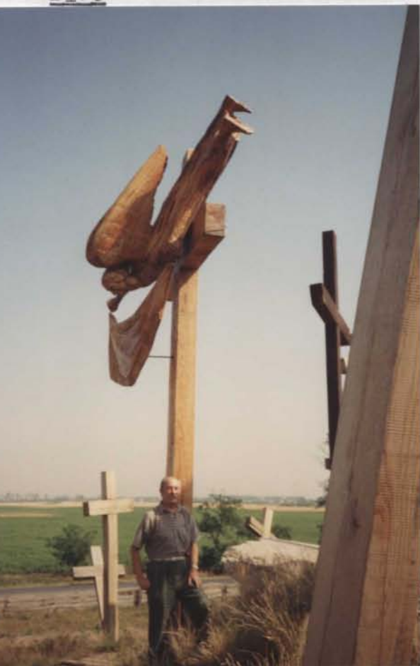
Az Ispotályos kereszt.

Ez a Rembaldus mester lovagjaival együtt résztvett a tatárok ellen vívott Sajó menti ütközetben, majd a menekülő IV. Béla