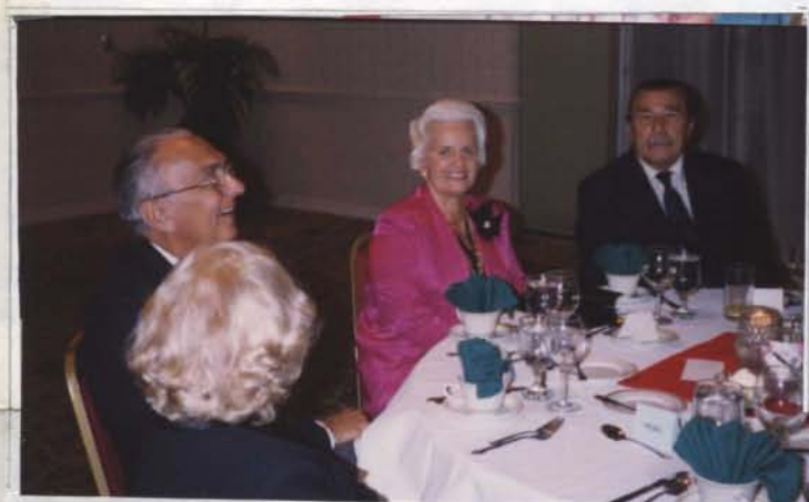
Képek a Borbála-estről.

--- 000000 --- 000000 --- 00000000 --- 000000 ---