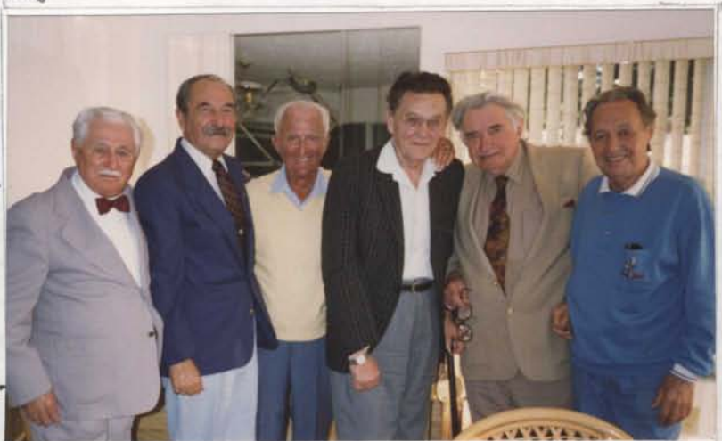
Csendőrök és tb. csendőrök a Csendőrnapon.