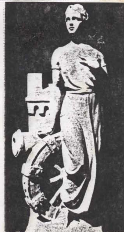
Szent BORBÁLA a Tűzerek Védsejntje