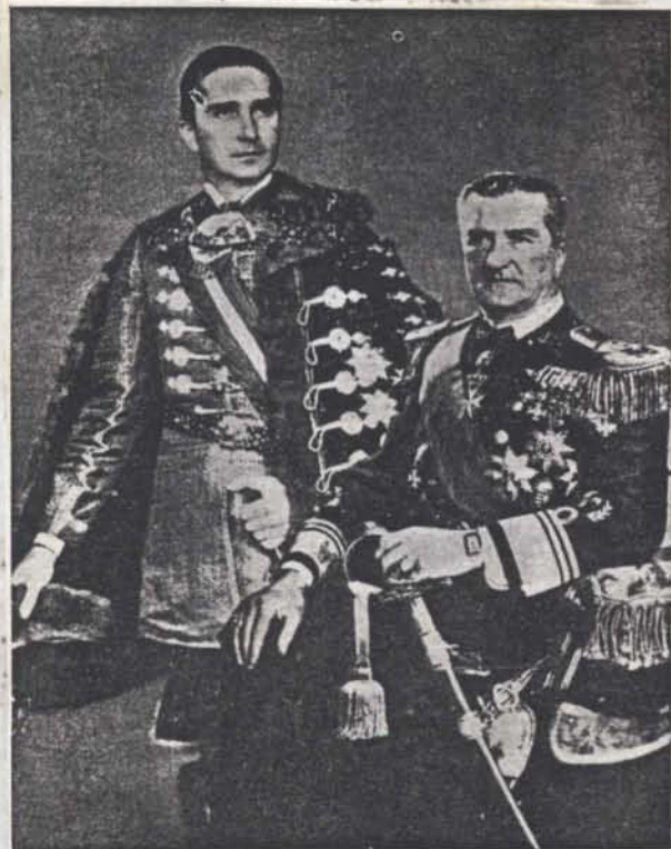
22. A kormányzó és fia, mint kormányzóhelyettes,