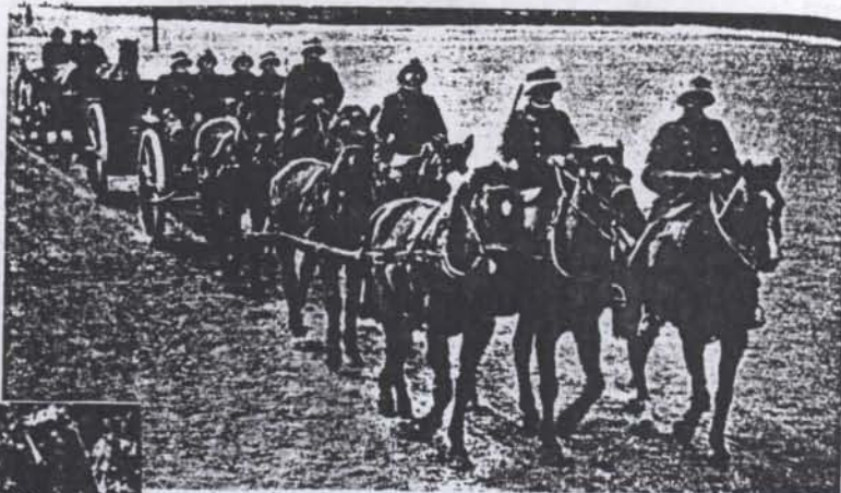
Könnyű ágyús félszakasz