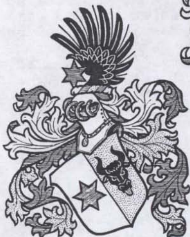
764. von Samson-Himmelsterna. Nobility by letters patent, 17th century.

Swedish heraldry has its origin in the Middle Ages and, in general, is not that different from the heraldry of Denmark. Both were greatly influenced by German heraldry. The history of the Scandinavian countries is very interlinked and so their heraldry developed its individuality rather late. Norway was united with Denmark by personal union from 1380-1814, and with Sweden from then on until 1905. In 1821 nobility in Norway was abolished by the Storting. Sweden was a partner of the Scandinavian union (with Denmark and Norway) from 1380-1523 (with intervals).