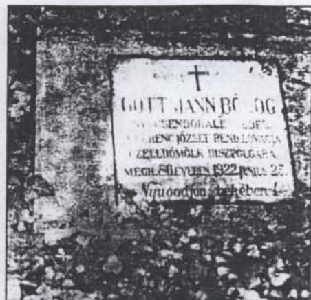
Göttmann Bódog sírja a celldömölki temetőben.

Göttmann Bódog kora ifjúságában hivatástudatot érezvén határozta el magát a katonai és a közbiztonsági szolgálatra. Egész pályája mutatja, hogy mintaképe volt a kiváló tisztnek. Vígkedélyű, szilárd jellemű férfi, igaz barát és jó