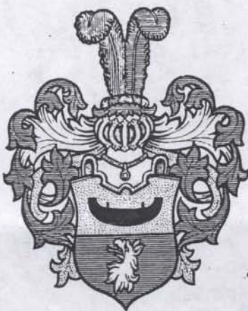
763. Gyilenbått. Nobility by letters patent, early 18th century.