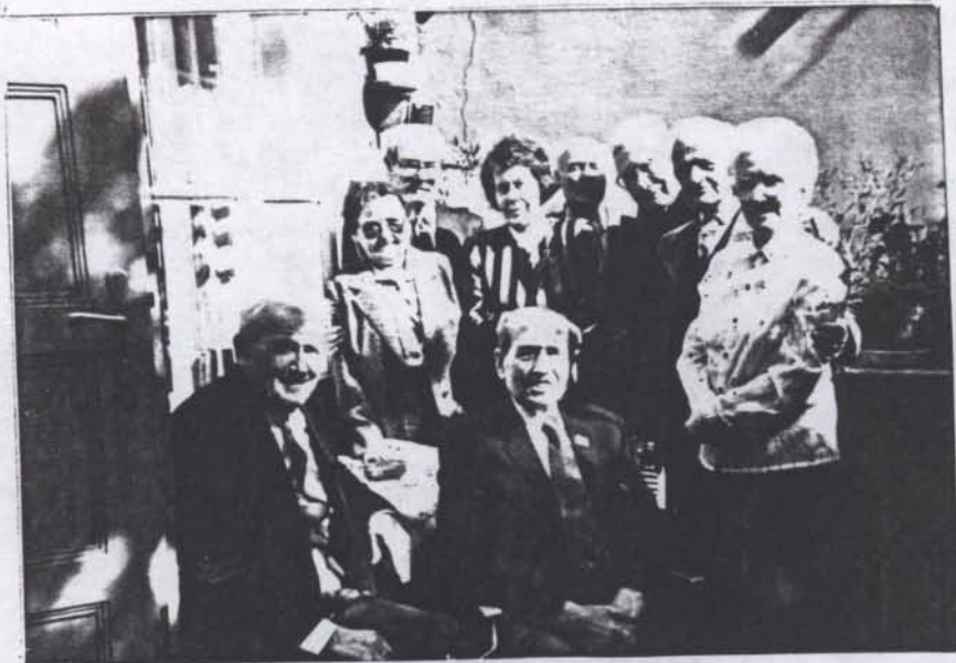
A szombathelyi bajtár- si összejövetel- 1997, május 10.-