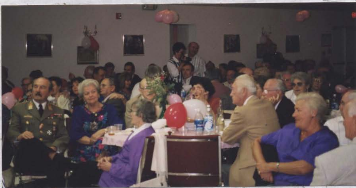
A szombat esti ünnepség közönsége-

..... A sárosotai K O S S U T H K L U B január 19-én tartotta meg az évi közgyűlést és megválasztotta az 1998-as évre az új tisztkart.-