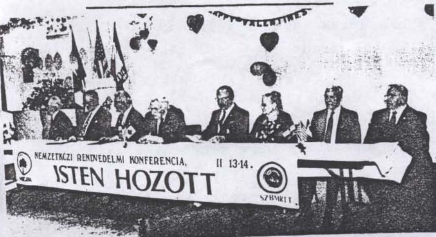
Csendőrnapi, 2000 Február 11-12-13.

Előjáróban köszönetünket fejezzük ki a sarasotai és környéki magyar testvéreknek, akik a veneciai Magyar Házukban évek óta vendékként látják a hazájukból kikényszerített volt M.Kir. csendőröket.