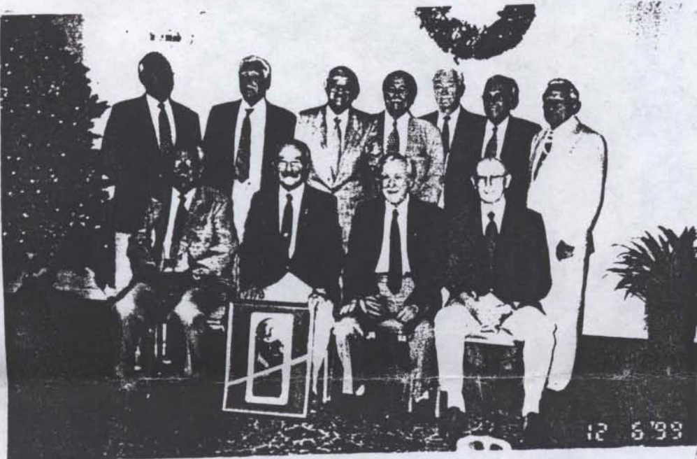
a 11 volt tüzér