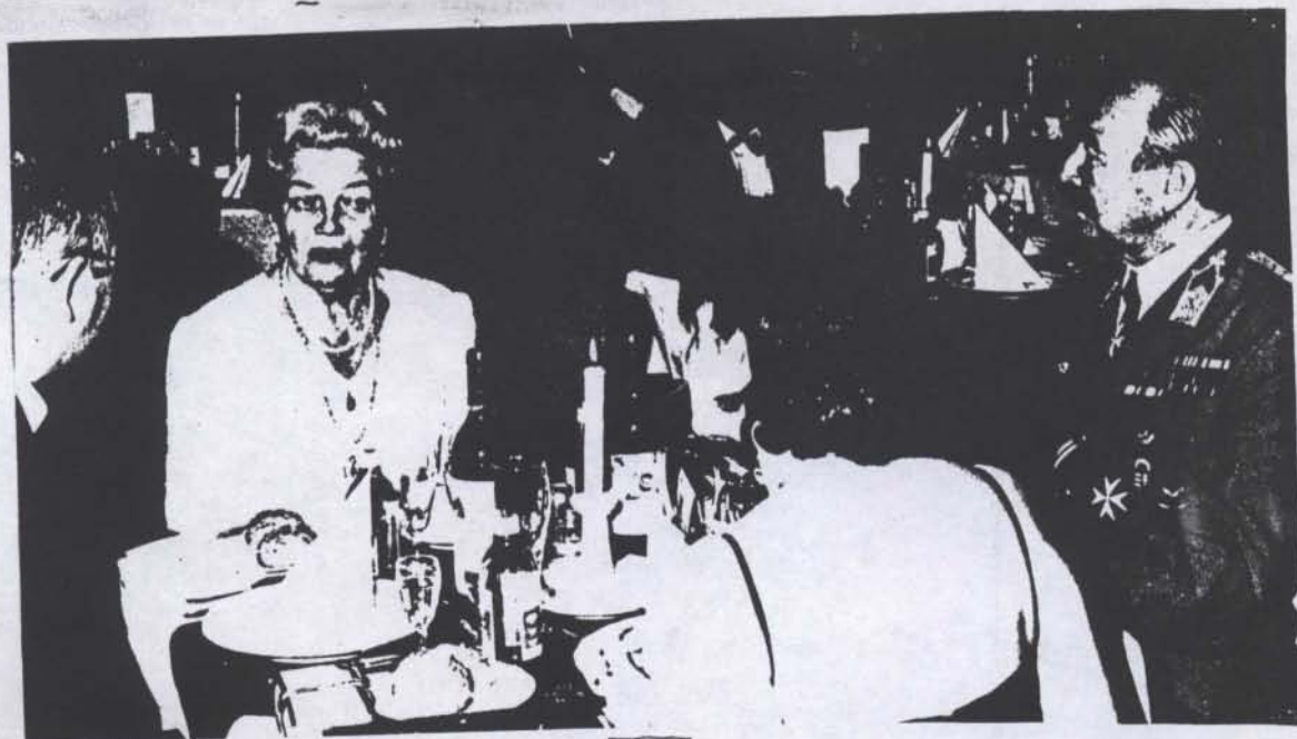
képek a budapesti Vitézi Bál-ról