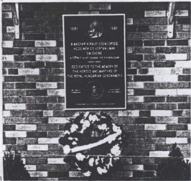
A youngstowni /Ohio, USA/beli csendőrhősi emléktábla