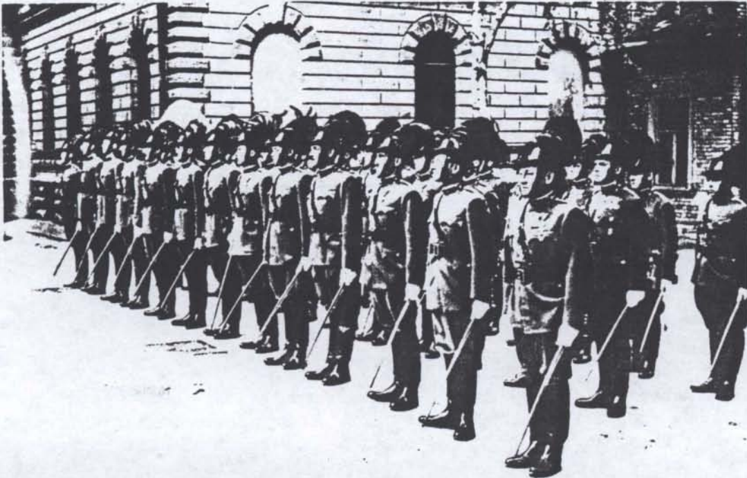
Csendőrhadnagy avatás 1940 július 9.-én

Kérdeztem szobatársaimat, hogy mi újság? - A válasz rövid volt. Mihelyt az utolsó évfolyamtársunk is bevonul, meg lesz a hadnagyavatás. Hisz lehetséges, hogy Erdélyben már ránk is szükség lesz. A Ludovikán már meg is történt a hadnagyavatás.