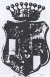
Római Sz. Birodalmi legyező Szeki Gróf TELEKI DOMOKOS. N.É. 1810. apr. 1-én. Megh. 1876. maj. 1-én.