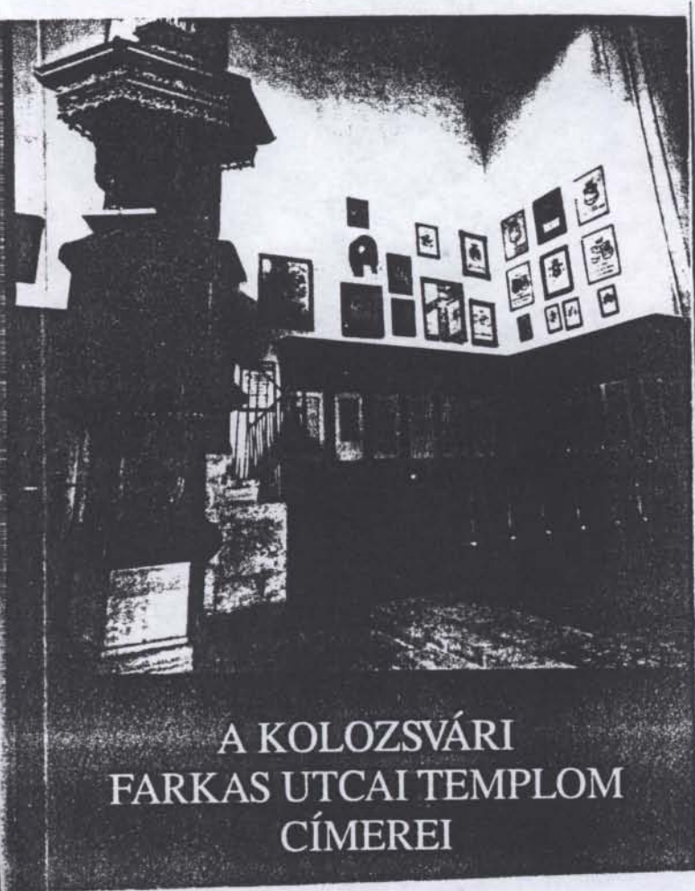
A KOLOZSVÁRI FARKAS UTCAI TEMPLOM CÍMEREI

Herladikusnak ez egy nagyon értékes könyv. 120 feketefehér és 14 színes címer van benne. Tele történelmi magyar családnevekkel. Az a kár, hogy a címerek leírása nincs meg benne, mert a fekete-fehér nyomatok sokszor elég gyengék. Így nehezebb vebő ki a címerjaz .