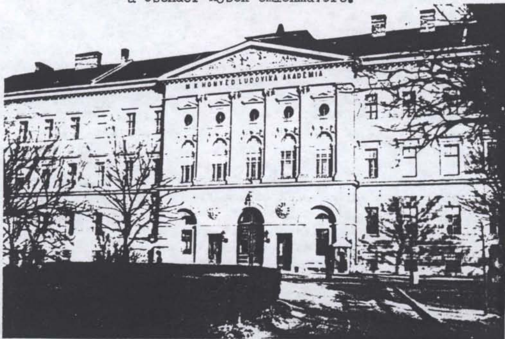
Az utolsó felvétel a még működő Ludovika Akadémiáról 1944-ben

„Hazai emlékeink sorában a Ludovika, ha nincs is pazar díszel ékesítve, és tartós kőanyagból felelőlegesen, fenn hirdeti egyszerű, nemes formaszépességével alkotójának tehetségét, ki ha magas művészetnek hasonló szerencsés külső viszonyok felelték volna meg, művet köbe faragva alkothatta volna meg, így biztosítván annak örök fennmaradását. Az utókor feladata