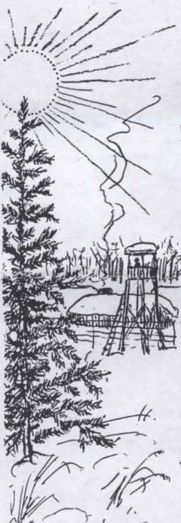
V. B. TAMÁSKA E. - 1988 -