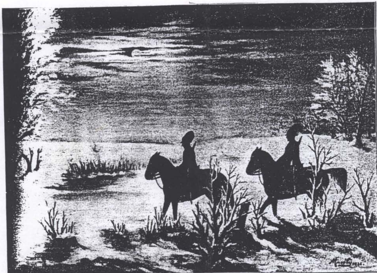
Emlék a hosszú télből.

... ooo ... /folytatás a következő számban