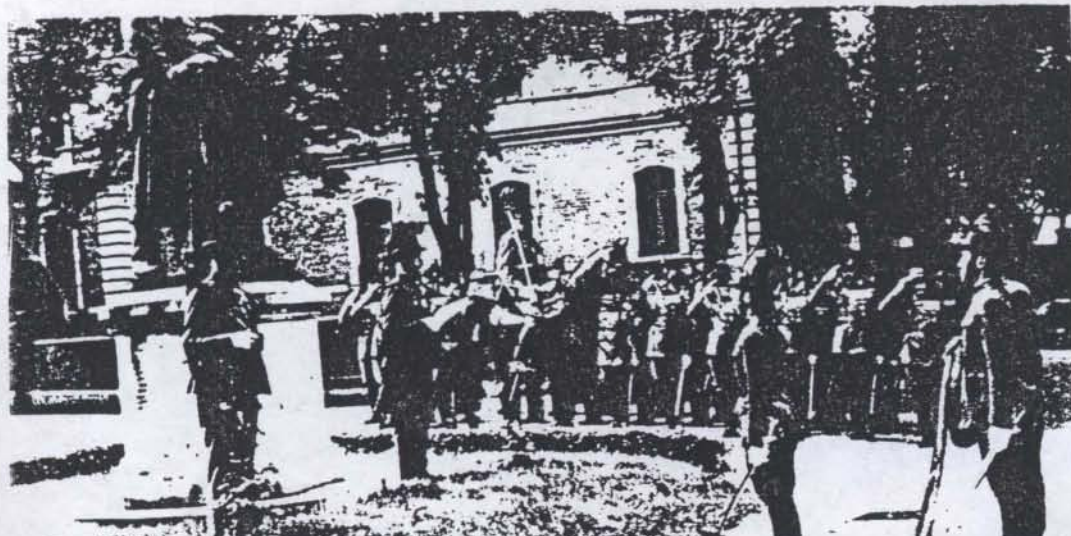
A Bözsörményi úti Csendőrlaktanya a mi időnkben. Tiszteletadás a csendőr hősök szobra előtt. A szobrot a kommunis- ták ledöntötték 1945- ben.