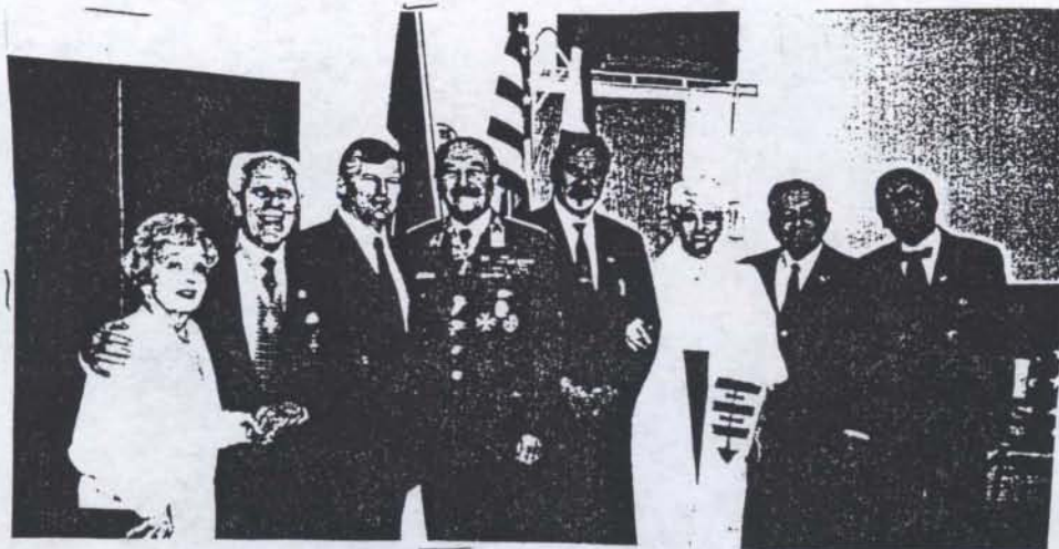
A Szent László Rend tagjainak egy csoportja