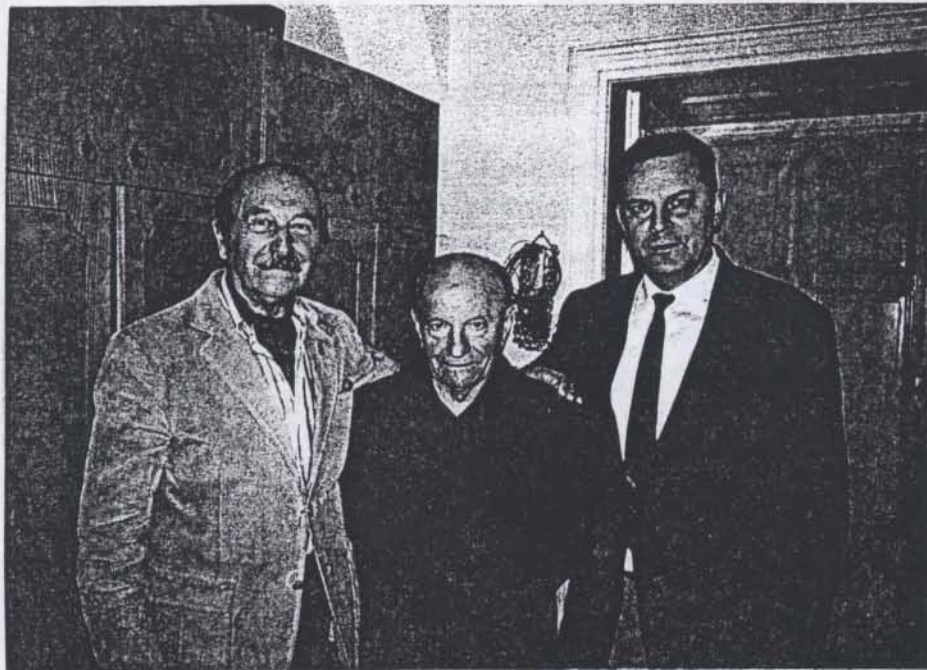
Utolsó látogatásom Székesfehérváron.

+ C S A T A P A P U N K N Y U G O D J B É K É B E N ! +