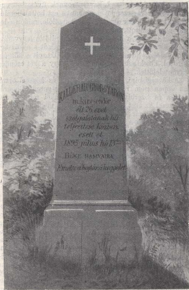
Kallér György sírköve.