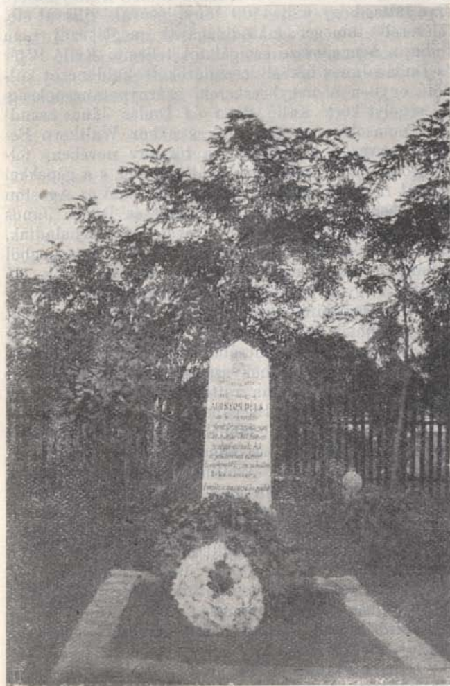
Ágoston Béla sírköve.