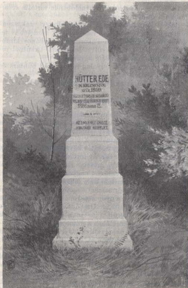
Hütter Ede sírköve.

Hütter csendőrnek bajtársai egy emlékoszlopot, illetve sírkövet emeltek a kápolnásnyéki temetőben.