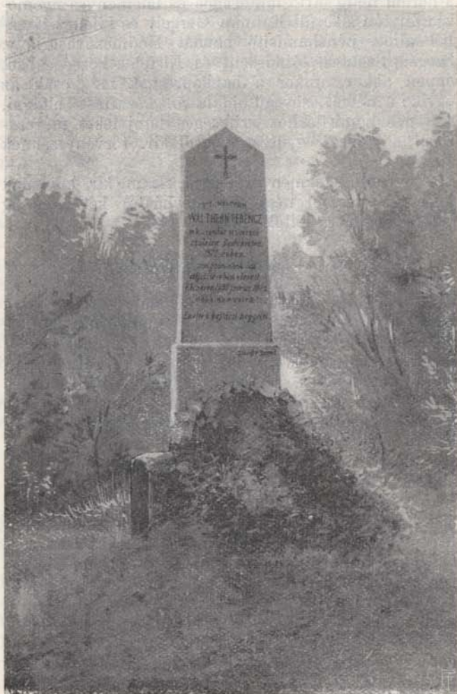
Walthern Ferencz sírköve.