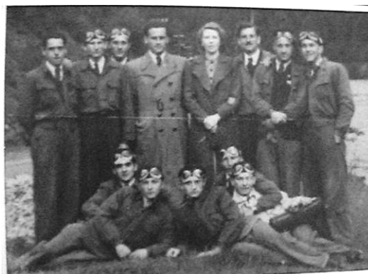
Sárrika és Laci bácsi (bajusszal), pilótákkal

24 órás késleltetésű német bomba gyújtó dokumentáció megszerzése Ukrajnában. ...Szivar becenevű műszaki tiszt barátunk jelezte Édesapádnak 1943- ban, hogy a németek kifejlesztettek egy 24 órás késleltetésű légibomba gyújtófejet, aminek a dokumentációját