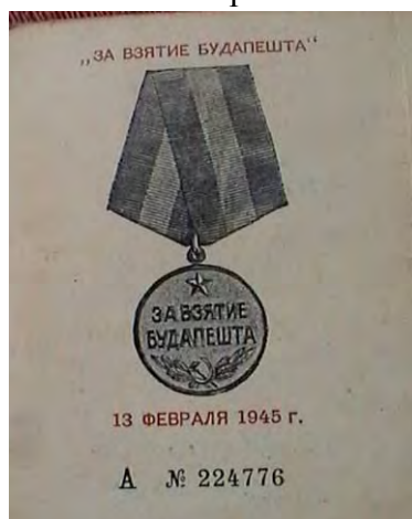
„Budapest bevételért” 1945 február 13.