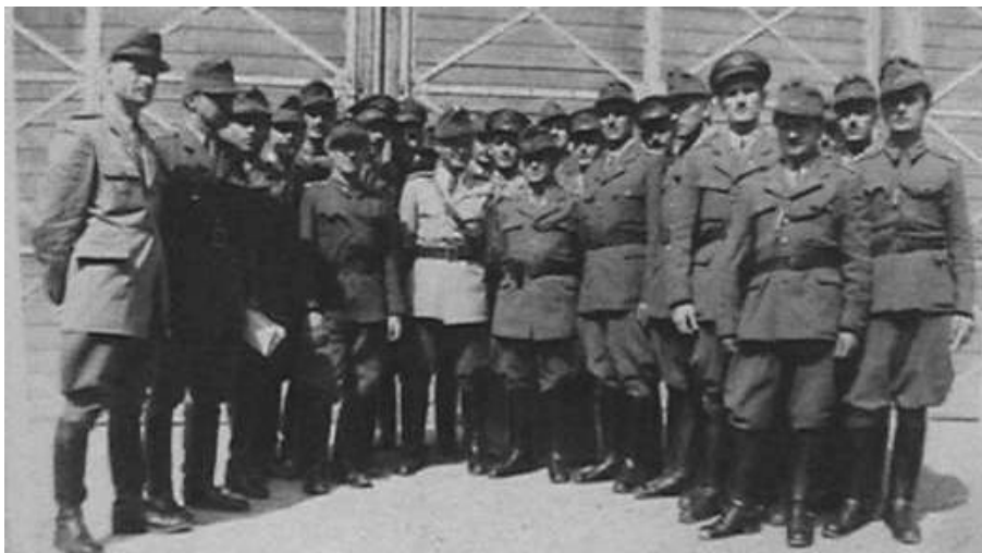
Édesapánk közepén, világos zubbonyban, tányérsapkát soha nem tett a fejére

Részvétele a Katona Politikai Osztály munkájában és a cél érdekében való belépése a Kommunista Pártba, utólag heves családi vitákat váltott ki. Feltették, hogy előbb vagy utóbb bajba kerül. Nagyszüleim hazatérte (46.03.08) után, 1946 ápr. 1-vel a Honvéd Határőr Főparancsnokságra (46 nov.20-ig) osztották be. Ezután a Rendőrséghez kerül, Karhatalmi alosztály vezető (47dec. 31-ig), majd kiképzési és szervezési alosztály vezető (1948.09.30-ig).