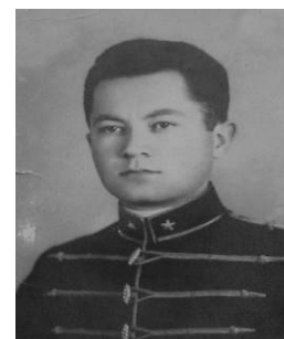
1937, erdész attilában