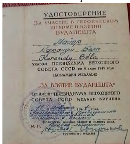
IGAZOLÁS Budapest hősieles ostromában és bevételében való részvételért,