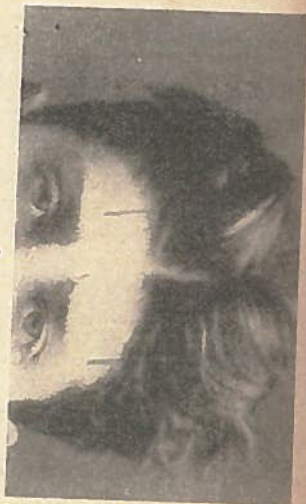
A homlok magassága és szélessége.

a — magas; b — alacsony; c — széles; d — keskeny.