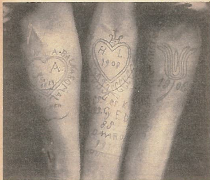
Karon látható tetoválás.

zott figyelemmel kell leírni. Ez itt nemcsak azt jelenti, hogy pontosan betartsuk azt a szabályt, mely szerint az ismertető jel minéműsége mellett annak alakját és elhelyezését is meg kell