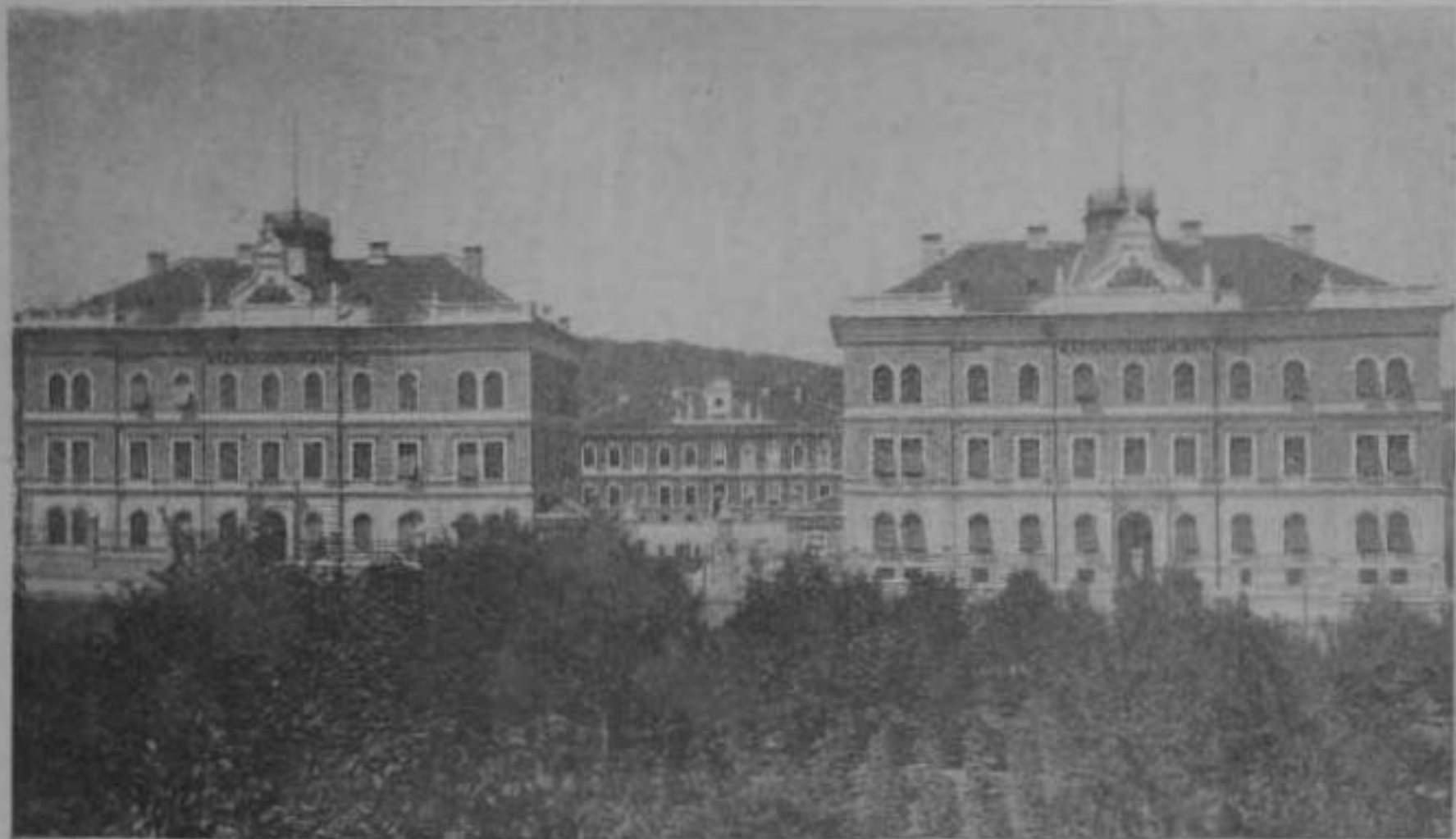
M. KIR. CSENDŐRLAKTANYA BUDAPESTEN, Körúti főhomlokzat,