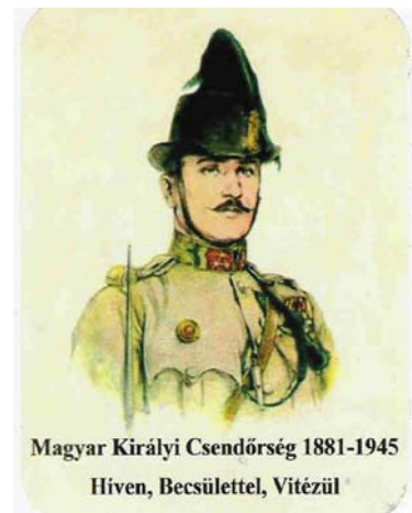
Magyar Királyi Csendőrség 1881-1945 Hiven, Becsülettel, Vitézül

Örömmel közlöm, hogy sikerült készítenünk egy matricát a mellékelt csendőr emblémáról (kb. 7,5 x 10 cm nagyságú), amely darabonként két dollárért (plusz postaköltség) rendelhető. Autóablakba, képkeretbe, valamely tárgyra ragasztva, stb. használható. Felvetődött az is, hogy készíthetnénk polóingeket (T-shirt) egy csendőrképpel a szív fölötti részén. Ez természetesen drágább lenne, darabonként 10-15 dollár körül. Örömmel venném a visszajelzésüket, hogy van-e eziránt megfelelő érdeklődés. Mindezzel az a célunk, hogy a csendőrség ügyére ezzel is felhívjuk a figyelmet és a köztudatban jobban tudatosítsuk.