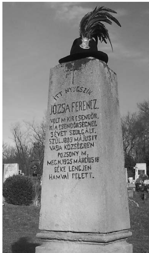
A rétsági (Nógrád megye) három fiatalember által helyrehozott csendőr sírkő