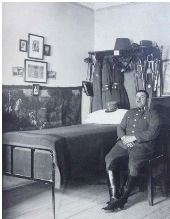
Az Ópusztaszeri Emlékpark őrs szobájának egyik részlete ezen kép alapján készül.