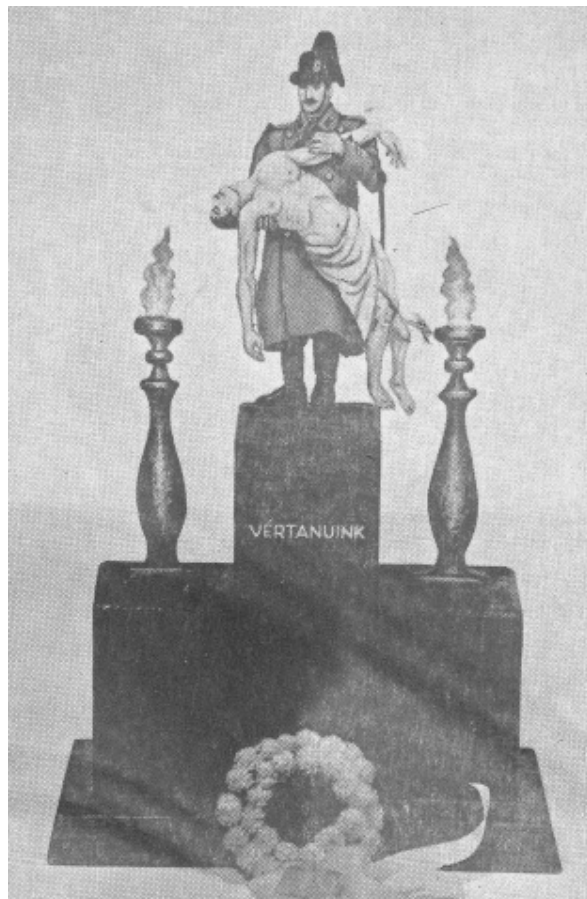
A Csendőr Vértanúk szobrának makettje, a csendőr művész Száraz András alkotása, mely az MKCsBK Múzeumából 2000-ben került a Hadtörténeti Intézet és Múzeum tulajdonába.