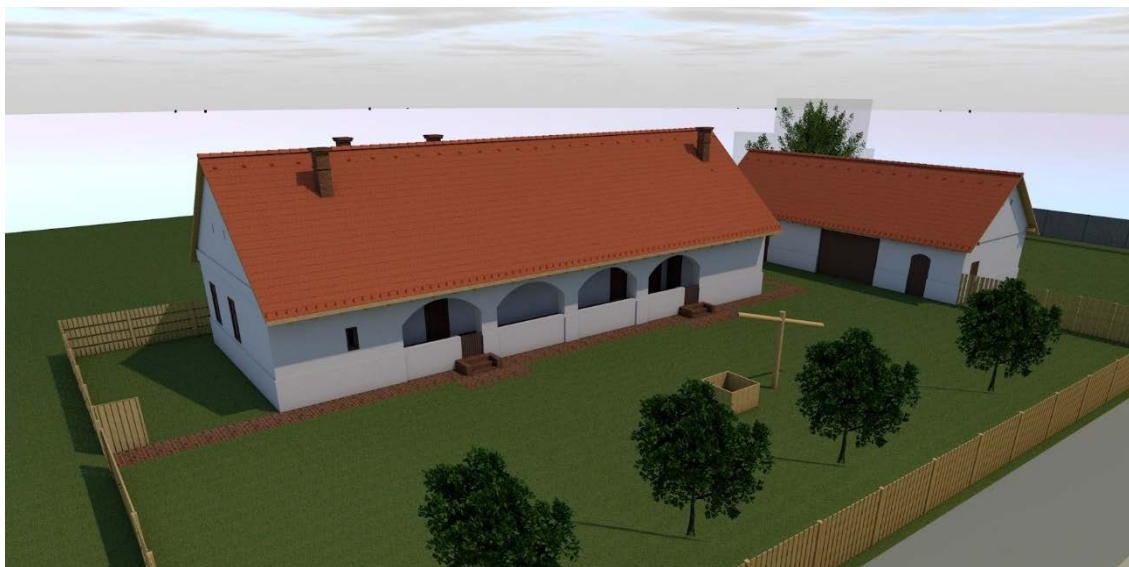
Az ÓNTE Skanzenjén felépítendő csendőr laktanya látványterve.

De a kommunista hatalom mindenáron el akarta pusztítani a csendőrséget, amelyet hatalomrajutása egyik nagy akadályának látott. Ezért a német megszállás alatti zsidó deportálások bűnét kollektívan a csendőrségre fogta, habár abban a csendőröknek csak mintegy 10%-a vett részt, még hozzá a rendőrséggel, pénzügyőrséggel és más hivatalos szervekkel együtt, és a tetejében a csendőrségnek a rendőrséggel ellentétben határozathozó joga nem volt (kizárólag végrehajtó szerv lévén)! De kollektívan mégis egyedül csak a csendőrséget ítélték el. Az ebből fakadó végtelen szenvedést, amely minden otthon