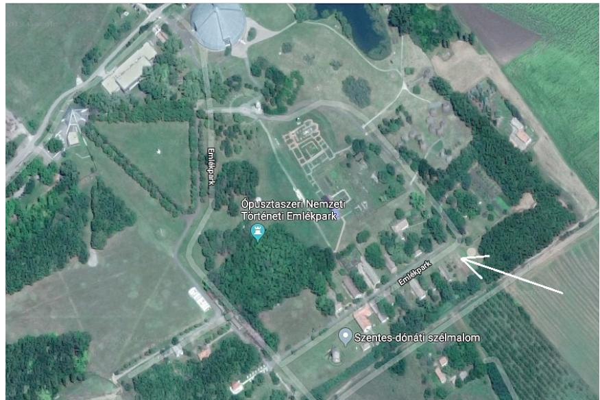
Légi felvétel az ÓNTE területéről. Fehér nyíl jelzi a jövő csendőr laktanya helyét (Google map)

Mivel a történelmi valóság megismeréséhez a csendőrség eredeti írott anyaga nyújtja a legmegbízhatóbb forrást, ezen könyvek és folyóiratok világhálóra vitelét tekintettük a legfontosabb