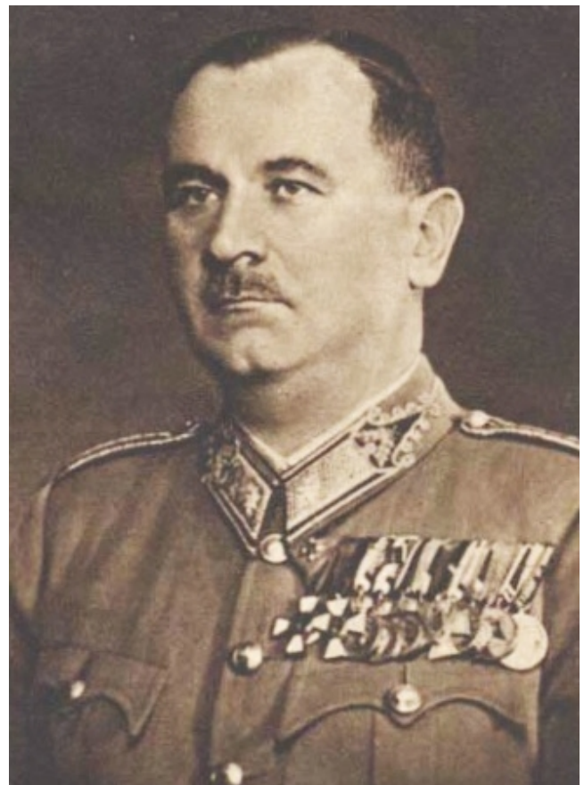
Pinczés Zoltán csendőr vezérőrnagy, a múlt század egyik legnagyobb magyarja

De ez a csendőr ellentétben állt a kommunista uralomra vágyók céljaival, akiknek a nemzet, az Istenben való hit, és a civilizáció értékei nem értékeket, hanem mindenáron elpusztítandó akadályokat jelentettek. Ezért a csendőrnek pusztulnia kellett 1945 után. És a kommunista rendszer mindent meg is tett az elpusztításukra. És nem csupán őket, de családjaikat is tönkretették.