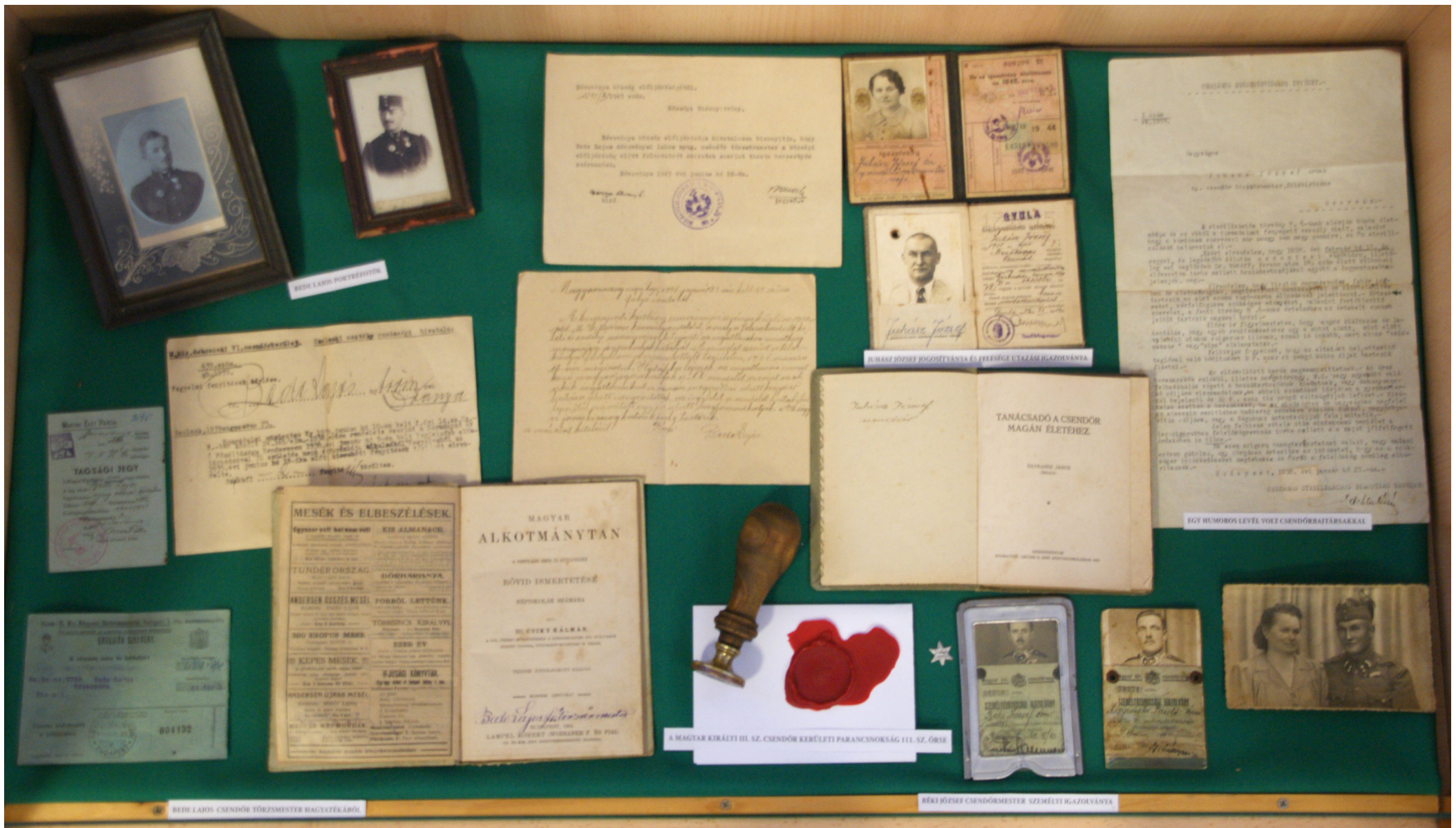
BÉDE LAJOS PORTRÉFOTÓI