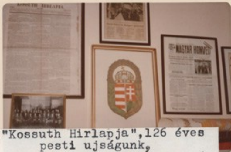
"Kossuth Hirlapja", 126 éves pesti ujságunk, "Magyar Honvéd" 1956-os száma, A Magyar Vitézi Rend cimere