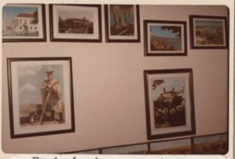
Fraknó vára nyugaton