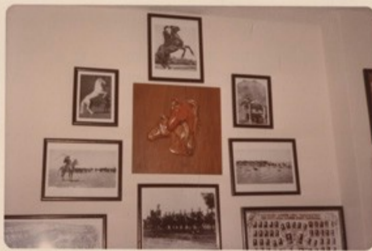
Lovascsendőr kiképzés Lovascsendőr iskolák fényképtablói