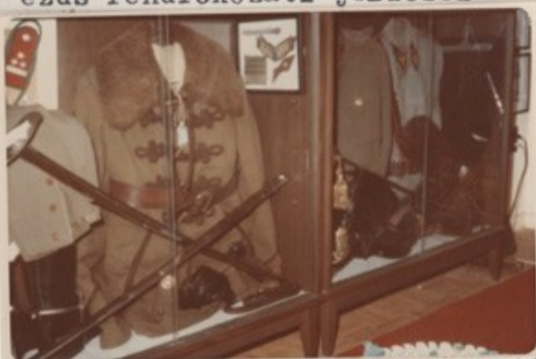
Csendőrtiszti zubbony, tiszti tollas kalap, tiszti kard, Bilgeri csizma, zsávolyzubbony, fekete társasági nadrág, cugoscipő