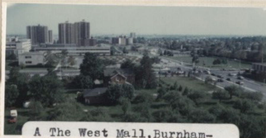
A The West Mall, Burnhamthorpe Road kereszteződése, baloldalon az etobicokei városháza /Municipal Centre/