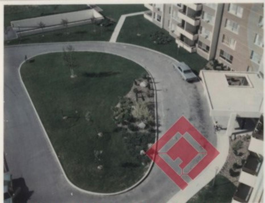
A főbejárat a 10. emeletről