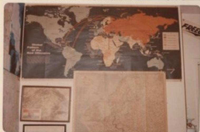
Tüntetéseinken használt autó-feliratok