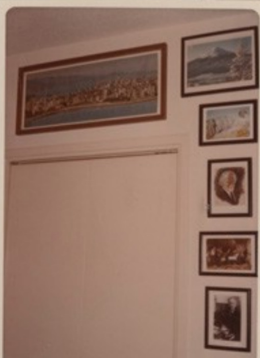
Magas Tátra, Kodály Zoltán, Nyirő József fényképei