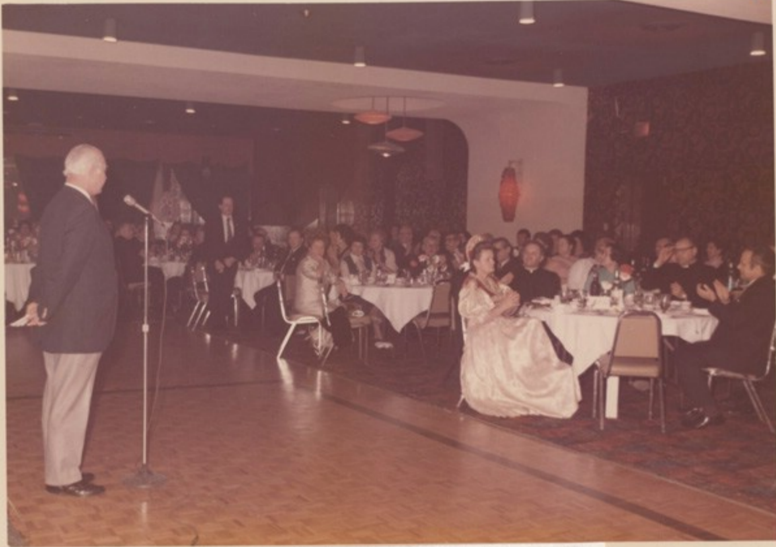
1974 csendőrnapiján Torontóban