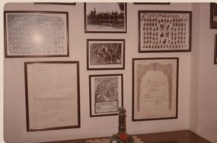
Németh Ferenc zls-i kinevezése 1917-ből Szurmay honvédelmi miniszter aláírásával, Németh Ferenc alez kitüntetési okmánya 1940-ből: Magyar Érdemrend Lovagkeresztje