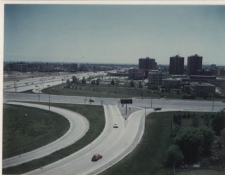
A 427-es szuperországút és a Burnhamthorpe Rd. kereszteződése, jobb oldalon az etobicokei városháza, a kép a Sussex House 12-ik emeletén készült