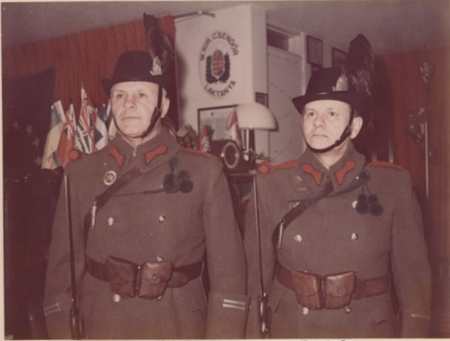
1974 tavaszán: egyenruhás csendőrjárőr a laktanyában eligazításon