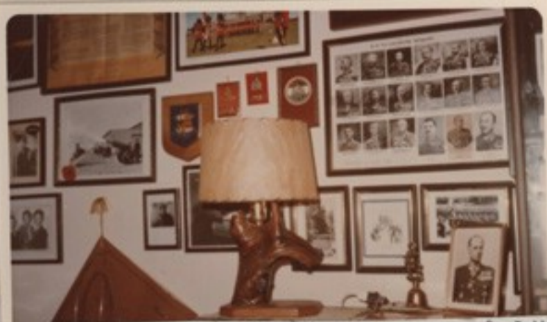
A M.Kir.Csendőrség összes felügyelői- nek fényképe, alul vitéz Kisbarnaki Far- kas Ferenc vezds 27.