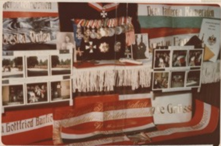
vitéz Taby Árpád őrgy teme- tési fényképei és a koszoruk szalagjai