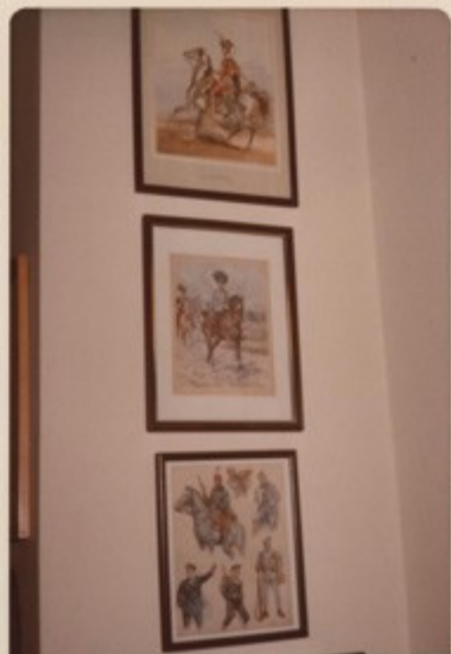
Magyar Nemesi Testőr Mária Terézia korában. Ferenc József király vezeti az osztrák-ma- gyar monarchia fegyve- res erőit.