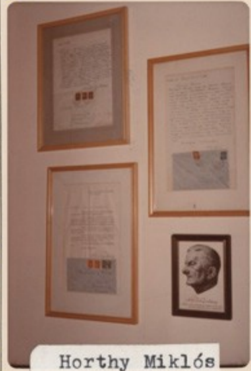
Horthy Miklós saját kézzel írott levelei.