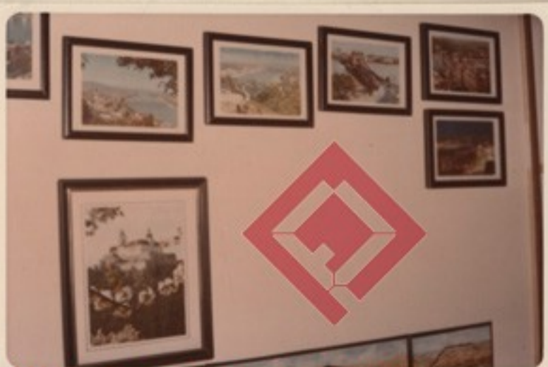
A budapesti hidak és a Duna-part történelmi emlékei