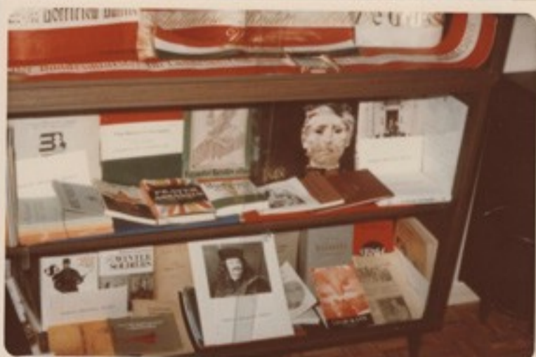
Rákóczi Szövetség emlékei