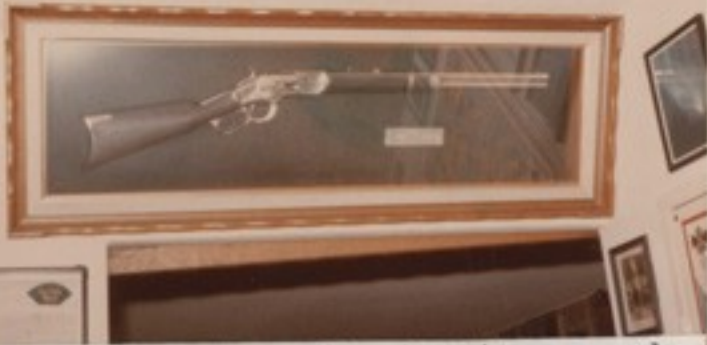
Az amerikai Winchester puska, mely 1873 után meghódította a "vadnyugat"-ot