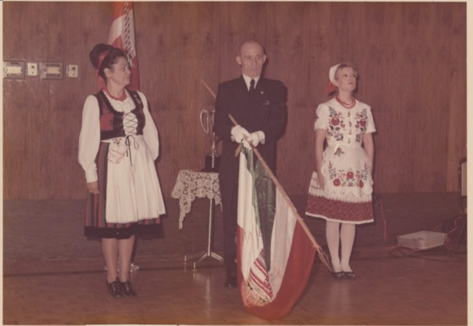
A Himnusz alatt meghajlik a csoport zászlaja...