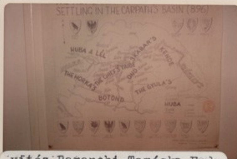
vitéz Baranchi Tamáska Endre szds rajza: a magyar törzsek letelepedése a Kárpátmedencében