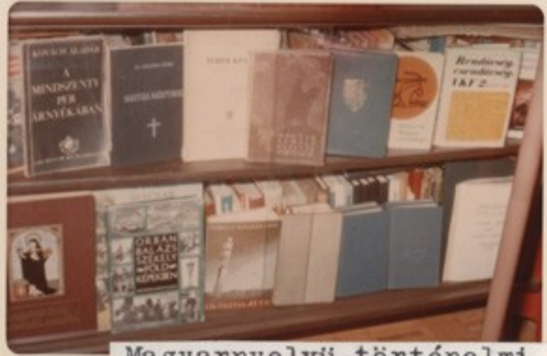
Magyar nyelvű történelmi könyvtárunk