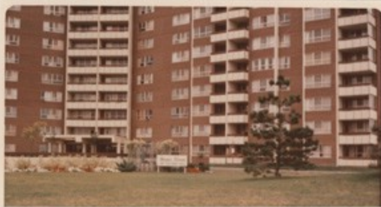
451 The West Mall