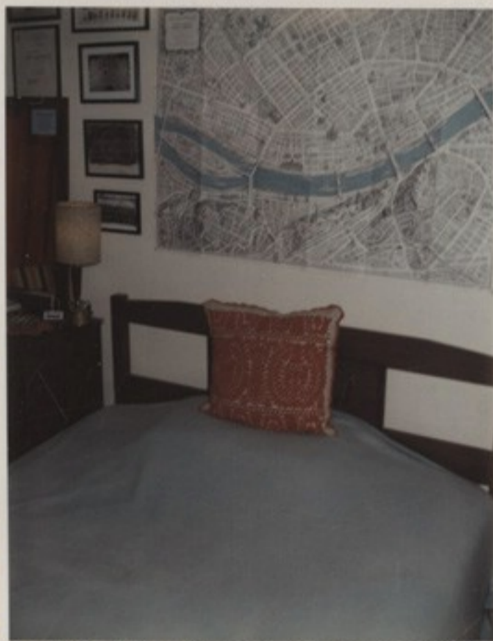
Budapest térképe a lovascsendőr ágy felett