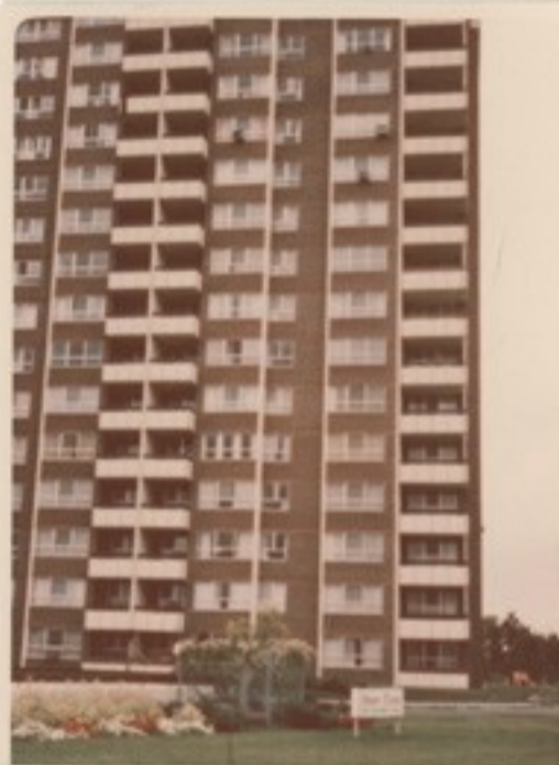
Az épület jobb szélén a II. emeleten /európai szokás szerint az I. emeleten/ foglal helyet a laktanya.