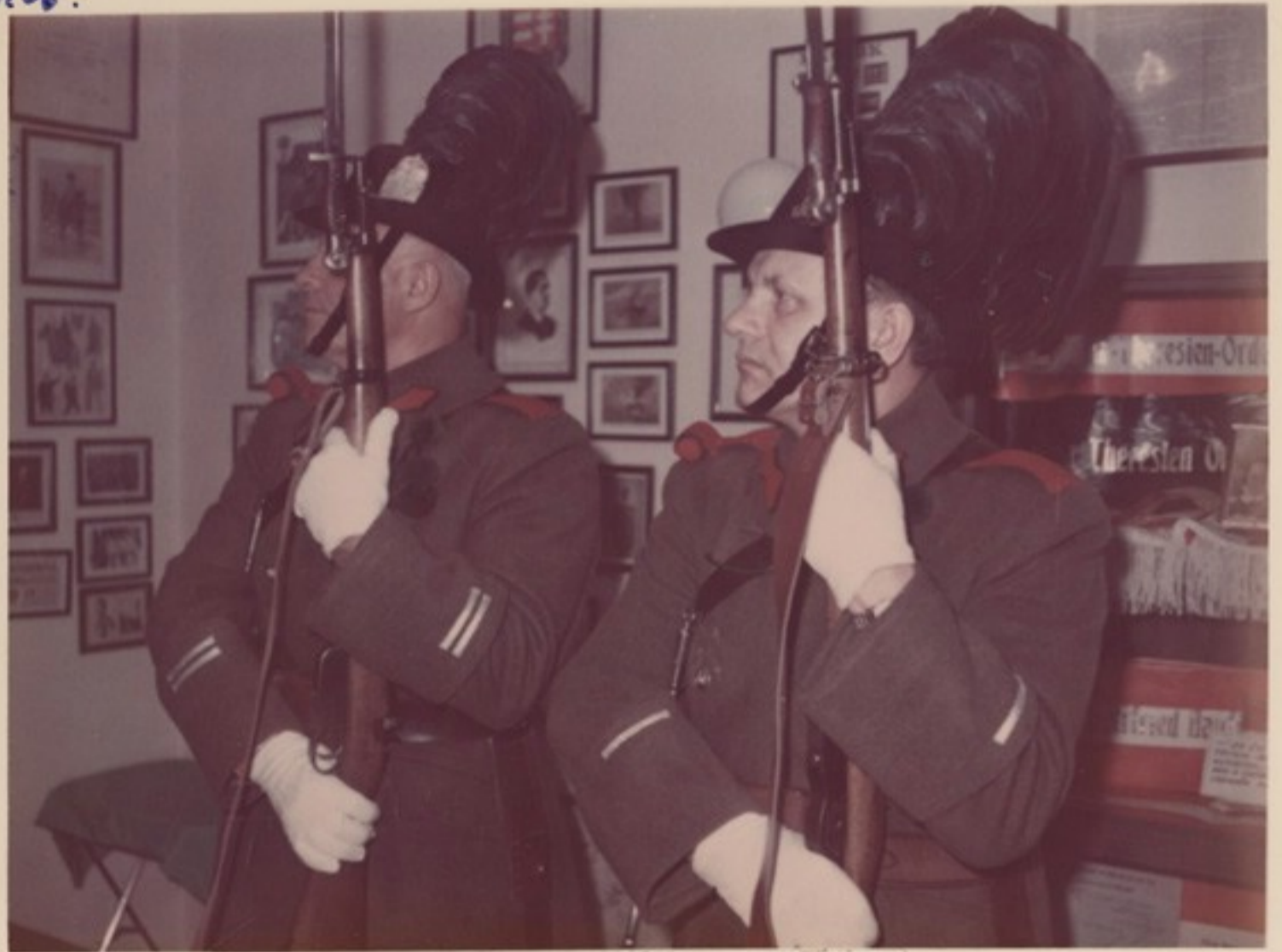
Járőrünk puskával tiszteleg a vitézi teremben...