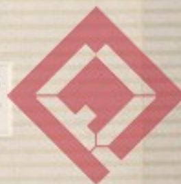
A Rákóczi Szövetség írott ereklyéi, em- lékei és könyvei