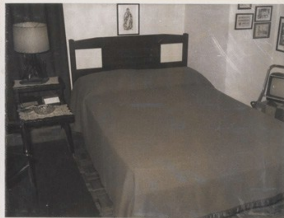
A 3.sz.átvonuló szállás széles, kényelmes ágya a kis televízióval 92.