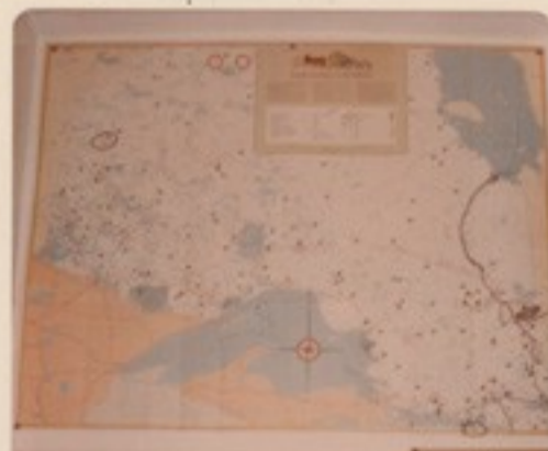
Észak-Ontario térképe a jeges tengerrel