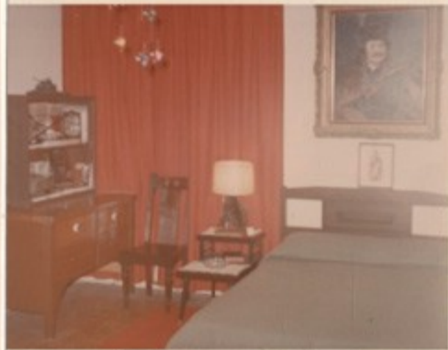
3.sz. átvonuló szoba