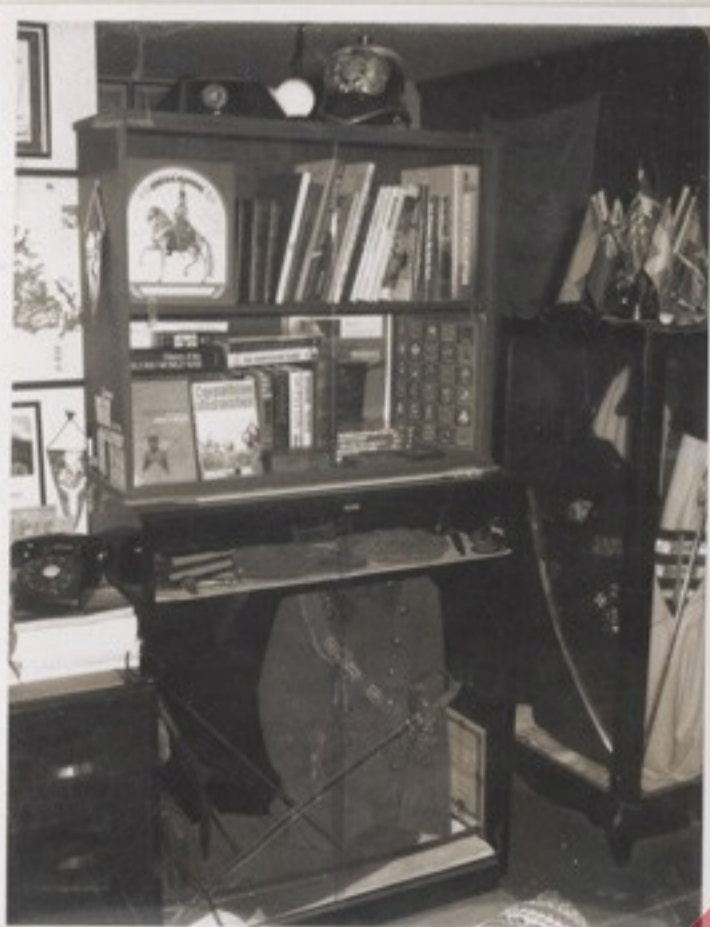
A legújabb üvegszekrény, katonai szak- könyvtár. Alul: Horthy Miklós vadászsap- kája, csendőrtiszti köpeny, a limanovai csatát megjárt huszárkard, folyamőr kard és repülő tör