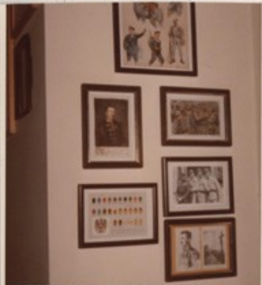
IV. Károly király emlékei. 73. Az I. világháború híres magyar kato- nái: huszár, honvéd- gyalogos, császárvá- dász, bosnyák gyalo- gos, haditengerész.