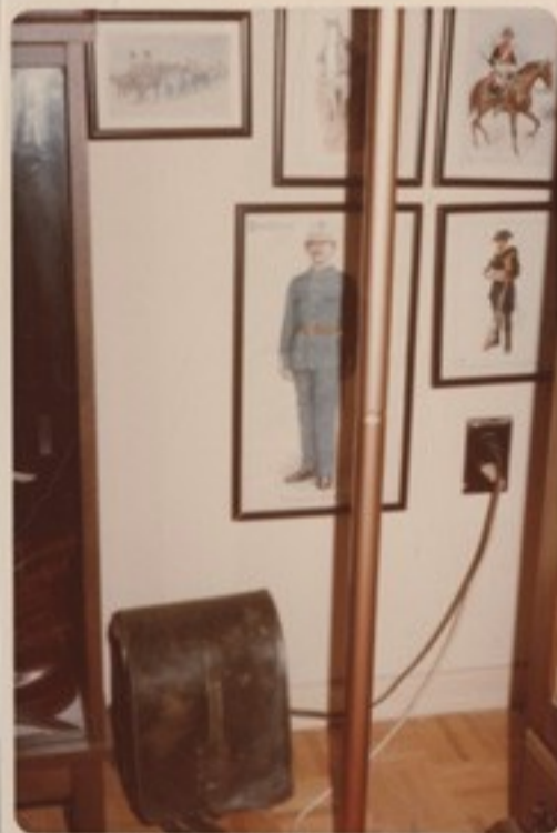
A még létező nyugati csendőrségek, me- lyeket Napoleon szelleme alapított: a kanadai, német, francia, olasz, dán, belga, spanyol és portugál csendőrök képei