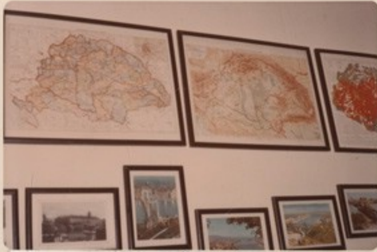
Magyarország történelmi térképei, a budai hadimuzeum, a Dunahidak fényképei a folyosón