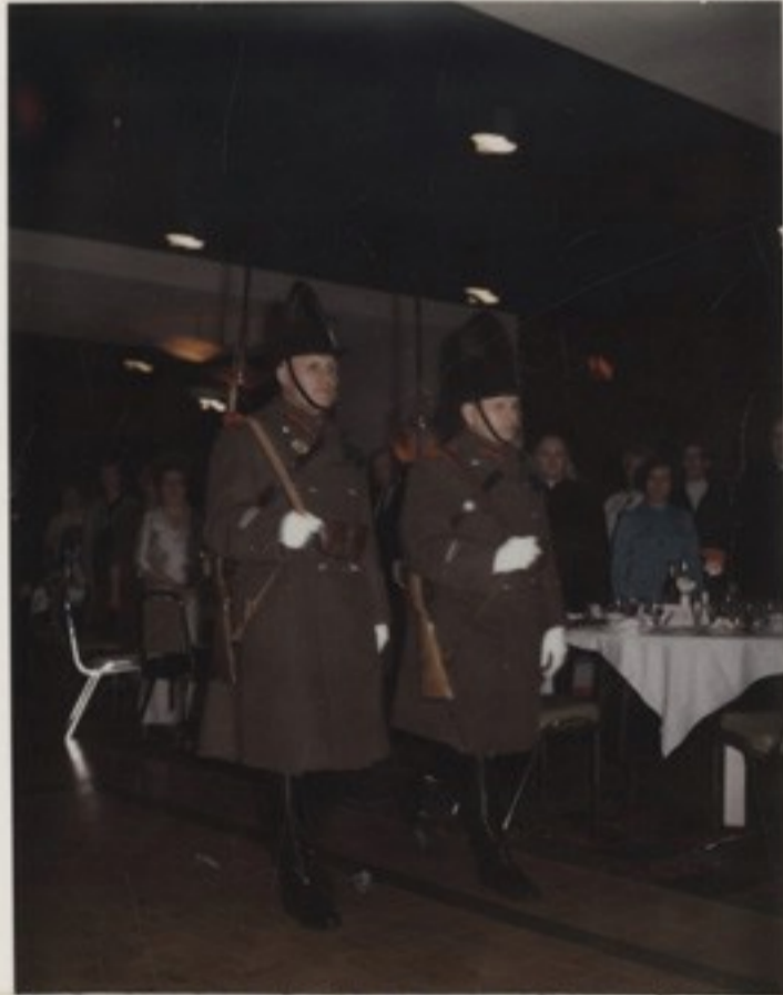
Az 1974-es torontói csendőrnapi közön- ségek könnyes szemmel, meghatódva, égi tü- neményként szemléli a csendőrjárőr be- vonulását