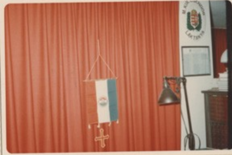
Az őrsiroda, a lakt. pk.lakása és emigráns őrhelye