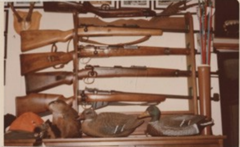
Részlet a laktanya fegyvertárából