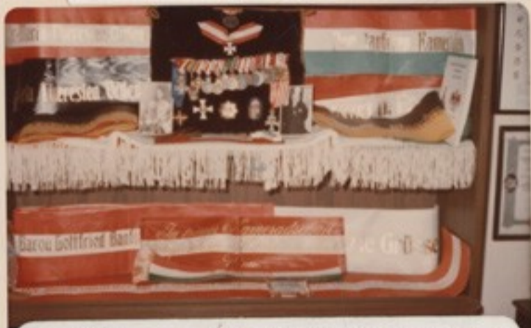
A Taby ereklyék üvegszekrénye