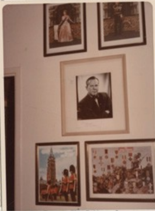
Királynőnk Fülöp herceggel, Pearson kanadai külügyminisz- ter, ki 1956-ban 38.000 magyar menekültet hozott Kanadába. A kanadai parlament Ottawá- ban és az angol világbiroda- lom katonai kitüntetései.