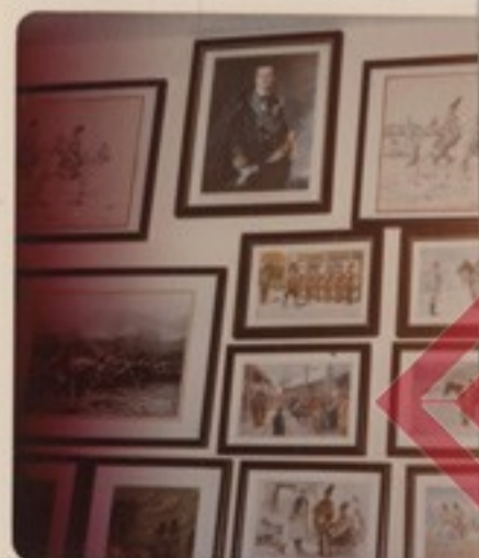
A híres csendőrlevelezőlapok ©szolgálatunk minden ágában