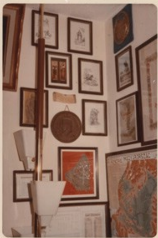
A kereszténység öt magyar Szentjének fényképei, Nobeldijas tudósaink, olimpi- ai sikereink bizonyítékai