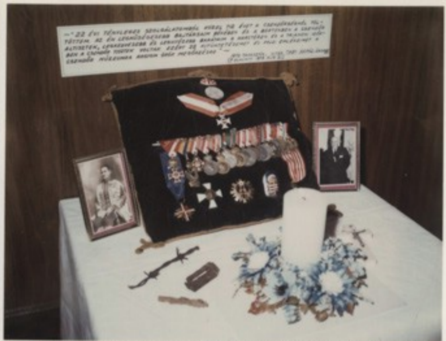
A laktanya ereklyéit gyakran kölcsön- kérjük nemzeti szervezeteink! Itt a Taby emlékek a torontói csoport vacsoráján