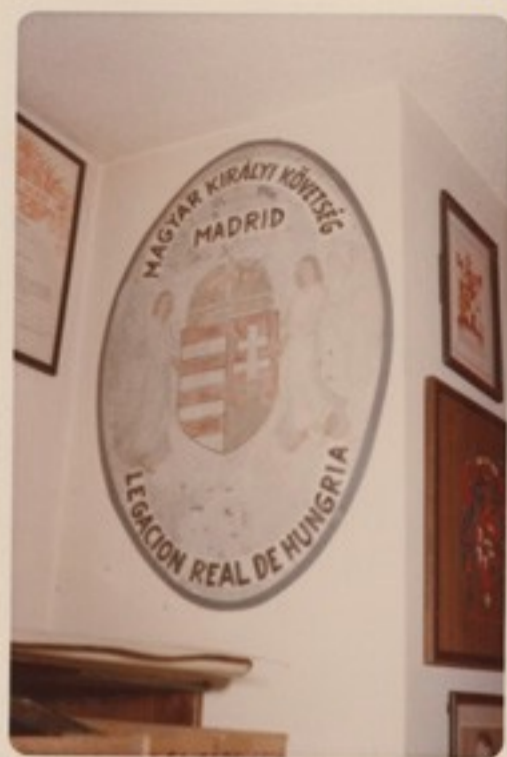
A volt madridi cimere