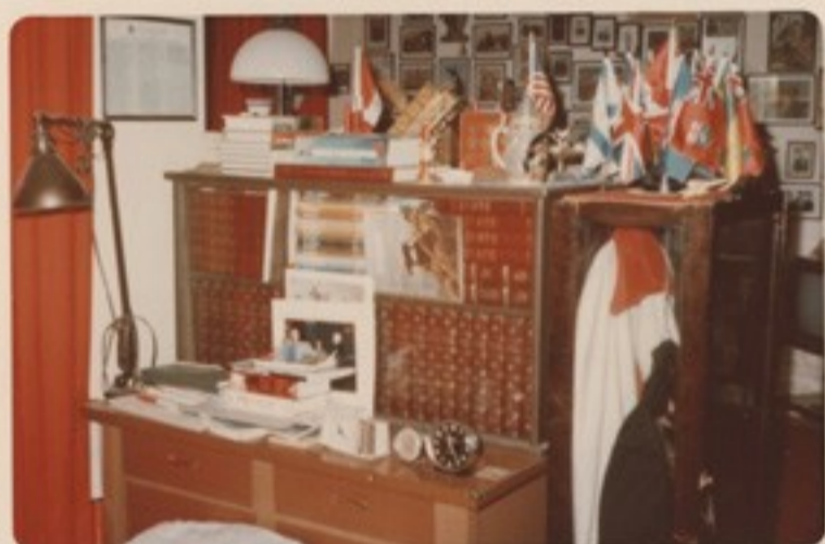
A "Britannica" lexikon, az angolszász világ nagy enciklopédiája, 93. készen a laktanya használatára