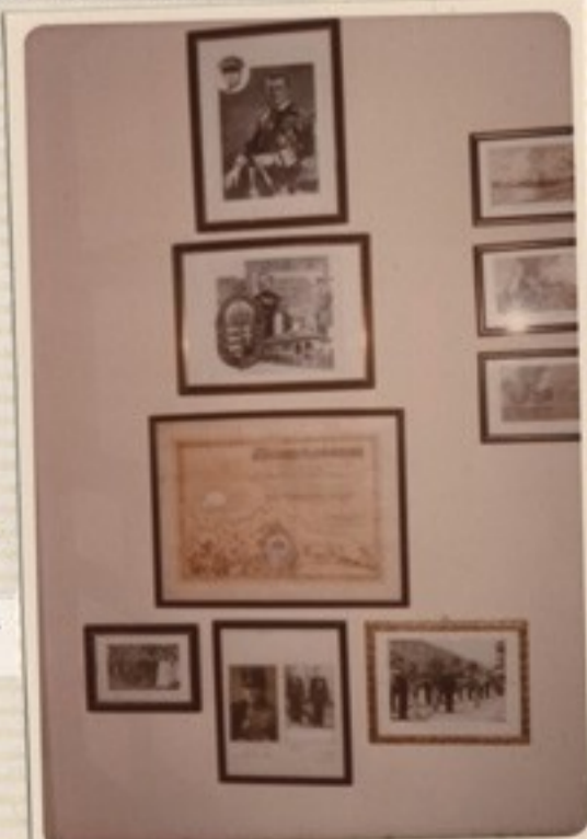
Vitézi ház, vitézi oklevél