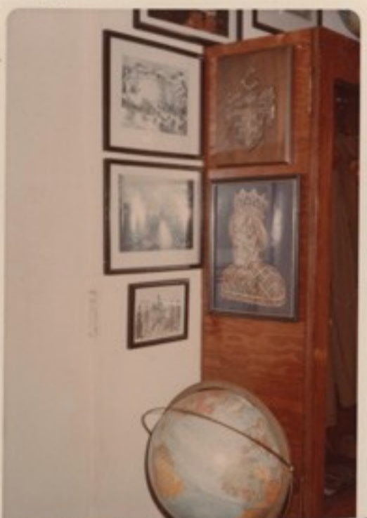
Szent László lovagkirályunk aranszobora, Szent László cimere, Kanada vadállatai