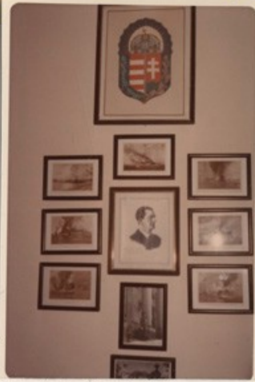
Vitézi Rend Muzeuma: Vitézi jelvény, Horthy Miklós sorhajó- -hadnagy és hajója, a Novara. Elsüllyesztett ellenséges hajók 72.