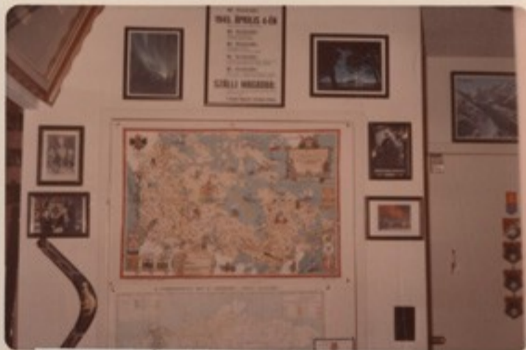
Kanada első térképe /Hudson Bay Company/