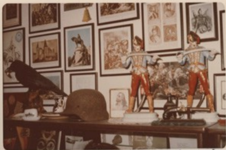
A híres herendi Hadik huszárszobor /az egyiket a kanadai katonai muzeum- nak ajándékoztuk/ 25.