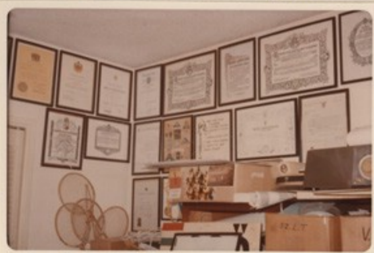
28 oklevél az órsiroda falán 95.