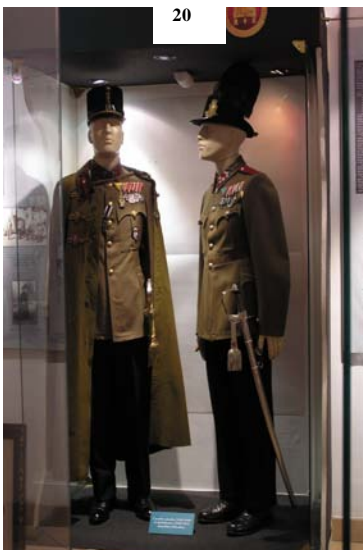
Csendőr százados 1926 M. öltözékben