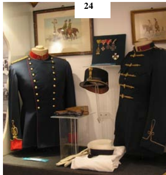
A Magyar Királyi Csendőrség századosi dolmánya a két világháború közötti időszakból

A két világháború közötti időszakban a Magyar Királyi Csendőrségnél rendszeresített díszegyenruhák és egyéb felszerelési tárgyak; háttérben a csendőrségi szolgálatot megőrkítő festmények