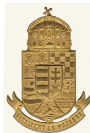
1911 Mintájú 1924-1945