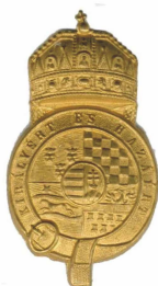
69 Mintájú 1881-1892