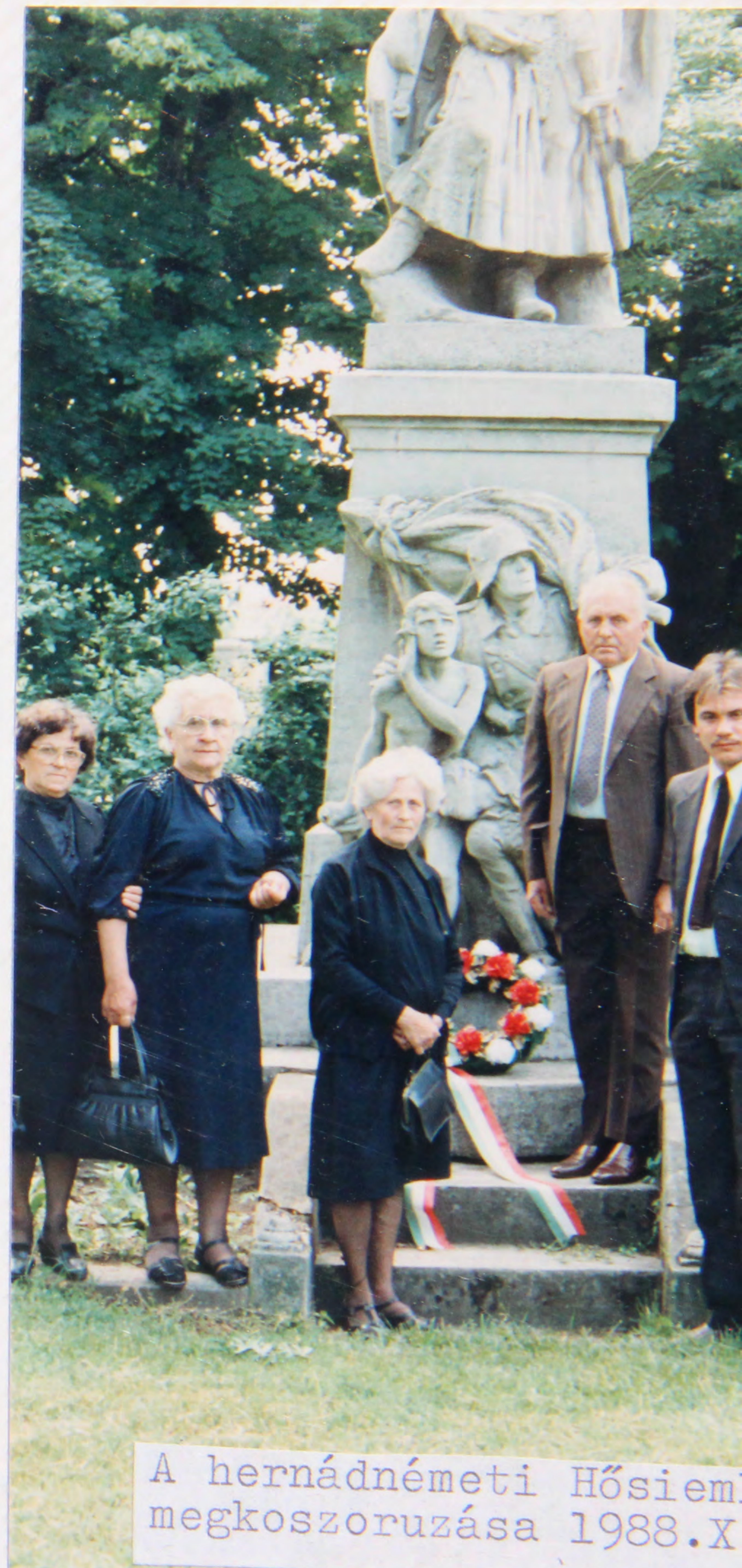
A hernádnémeti Hősiemlék megkoszorúzása 1988.X.