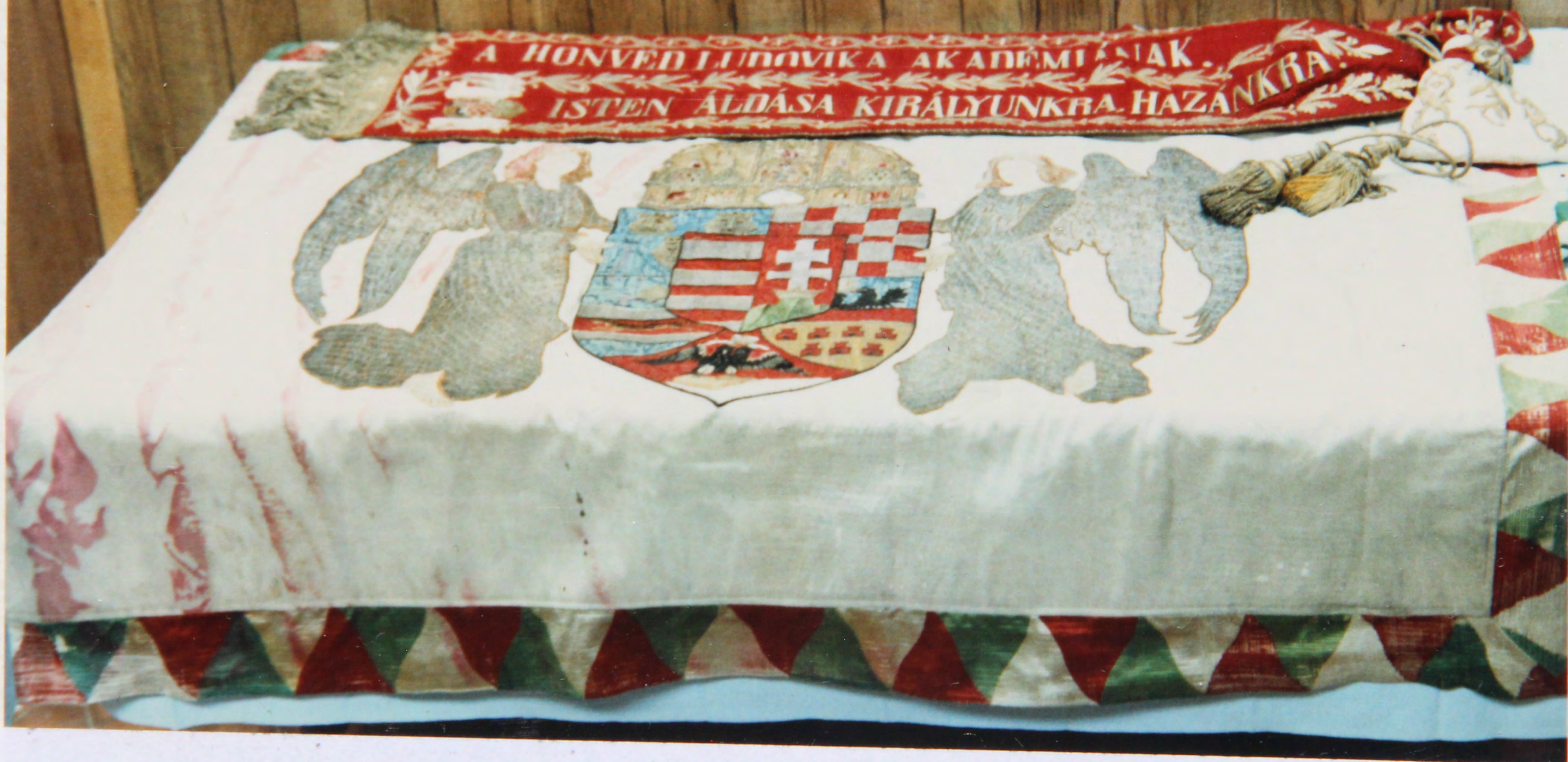
A M. Kir. Honvéd Ludovika Akadémia zászlója és szalagja a 45 éves találkozóán ORLANDO-ban /FLA., USA/ 1986. VIII. 21-23-ig.