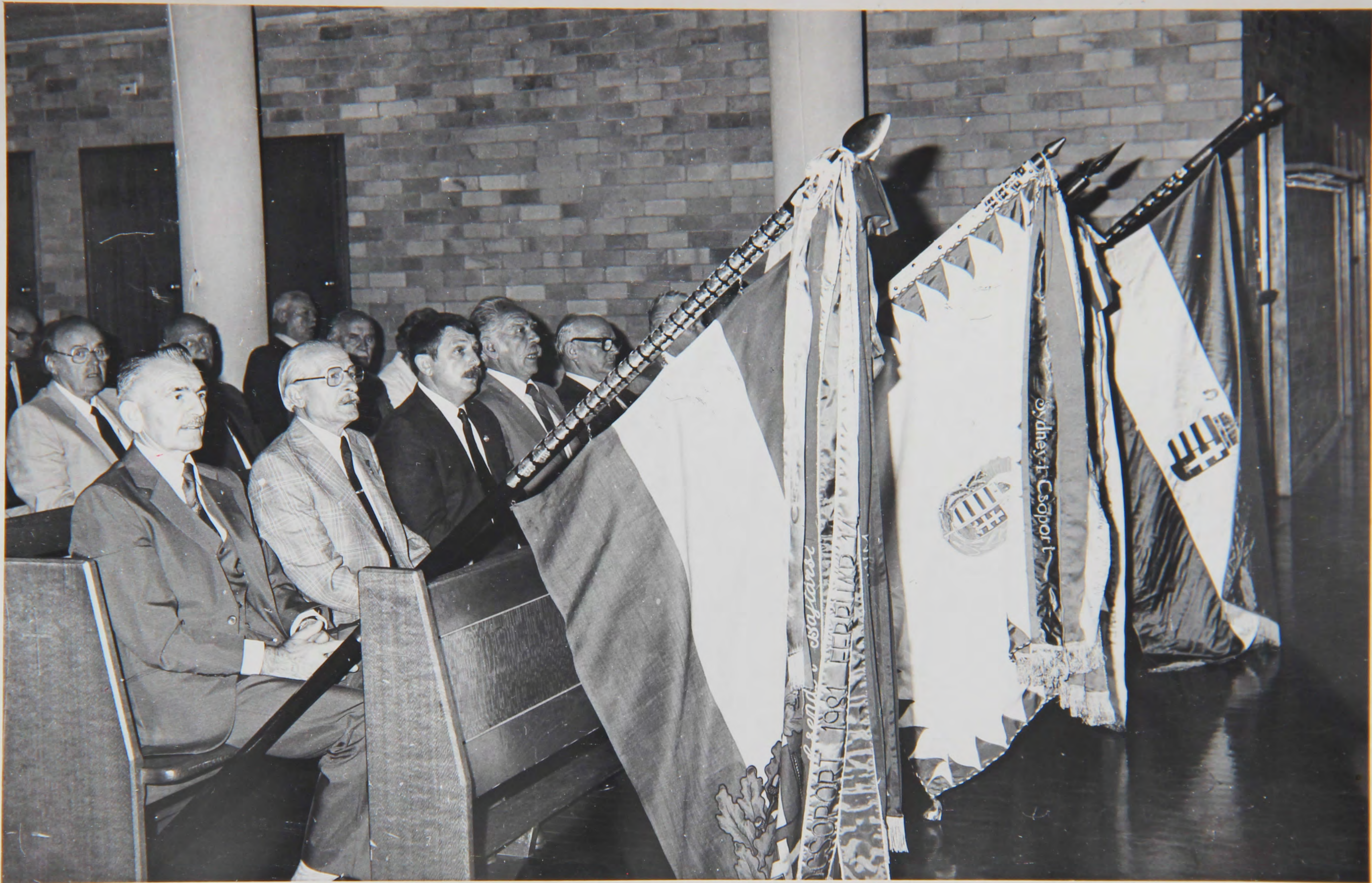
A bajtársi közösségek zászlói Sydneyben, 1985. II20-án Buda védelmében hősi halált csendőrökért mondott gyász-misén.