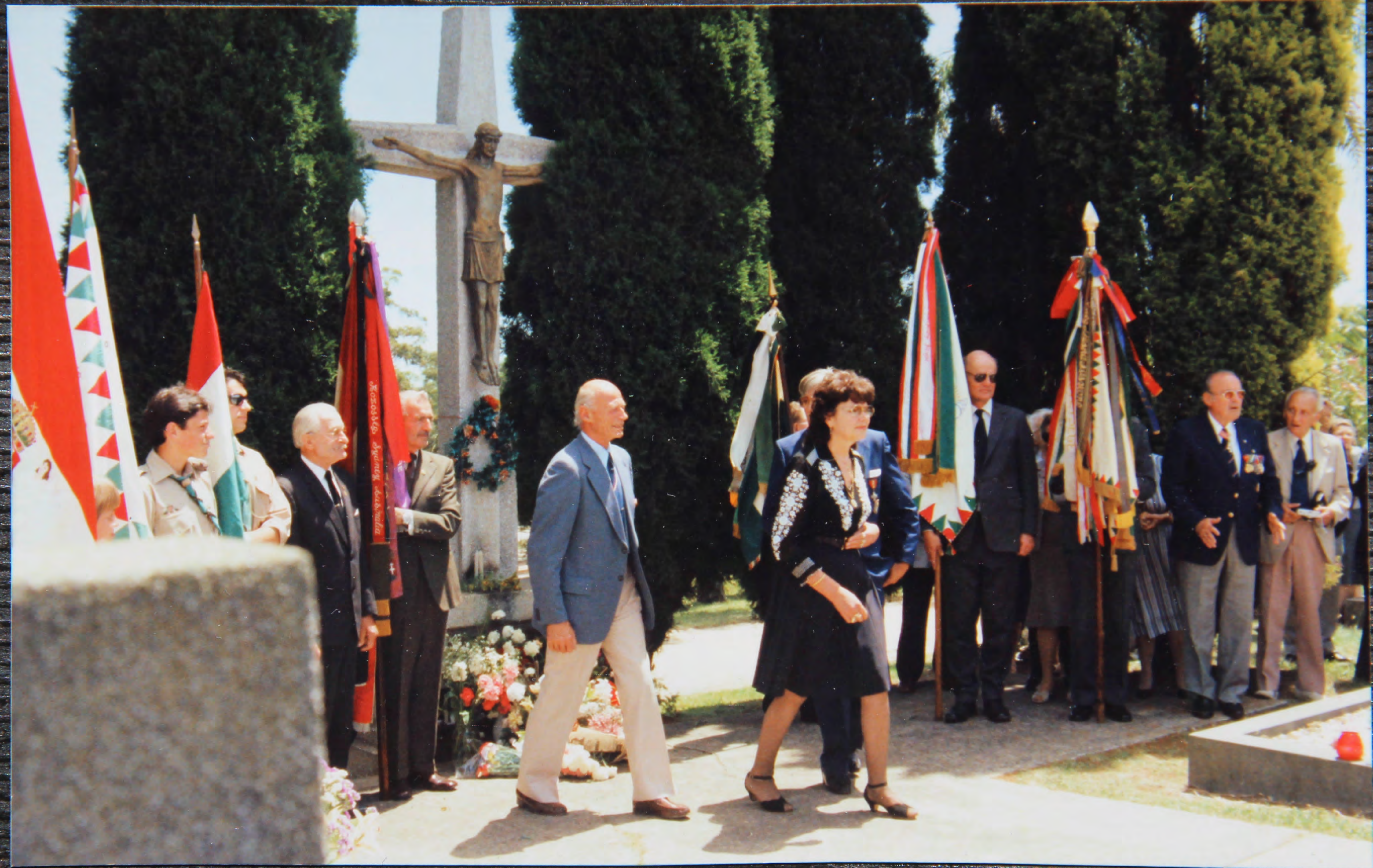
Koszoru letétel SYDNEY-ben a M.Sz.Vsz. 30 éves évfor- dulóján, 1986.XI.2-án. A kereszt mellett balra: a cső.csoport zászlója.