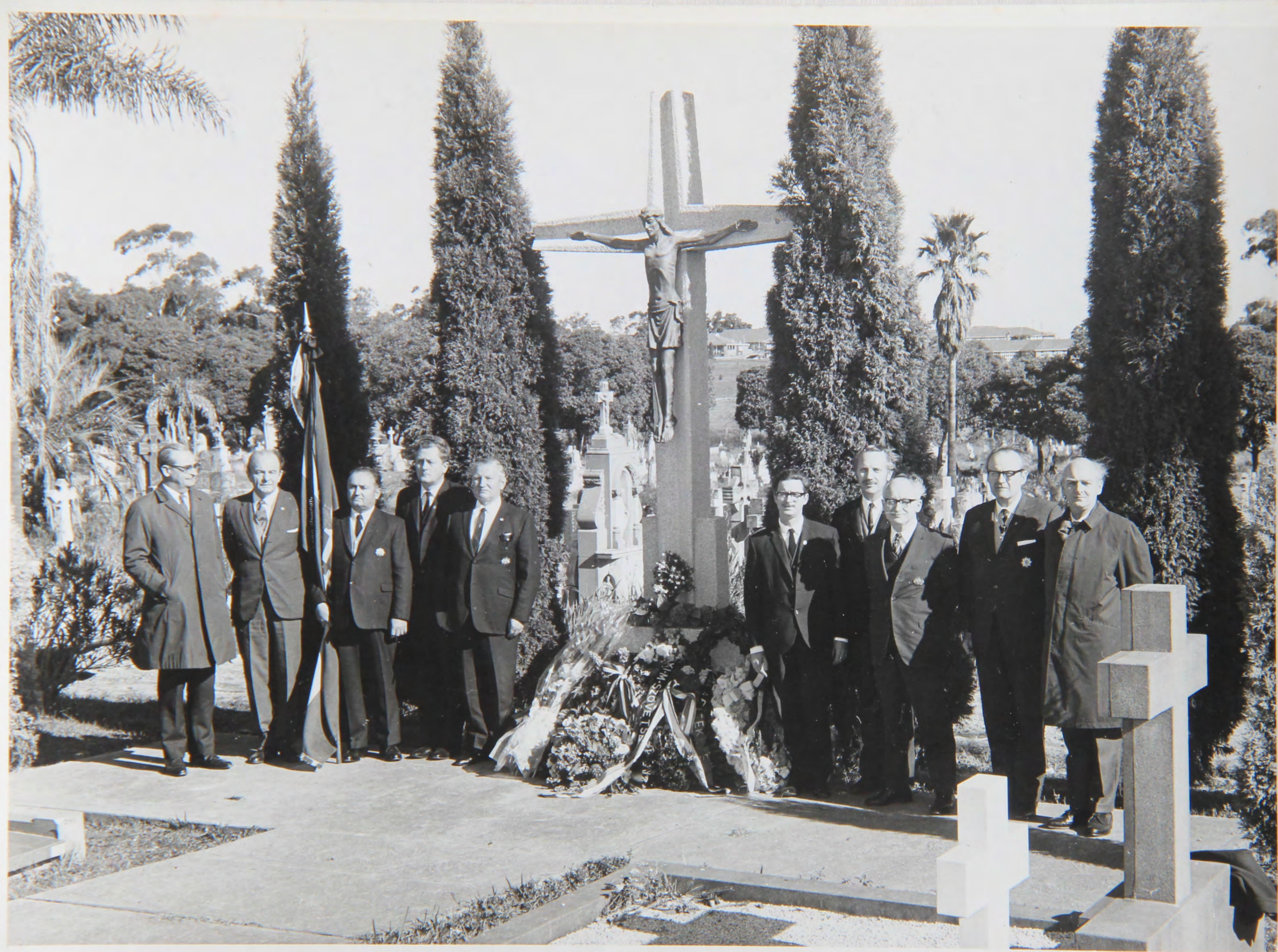
Sydney Hősök napja 1962-ben

... esenélj sarat, ... eberenyi Janos orml.