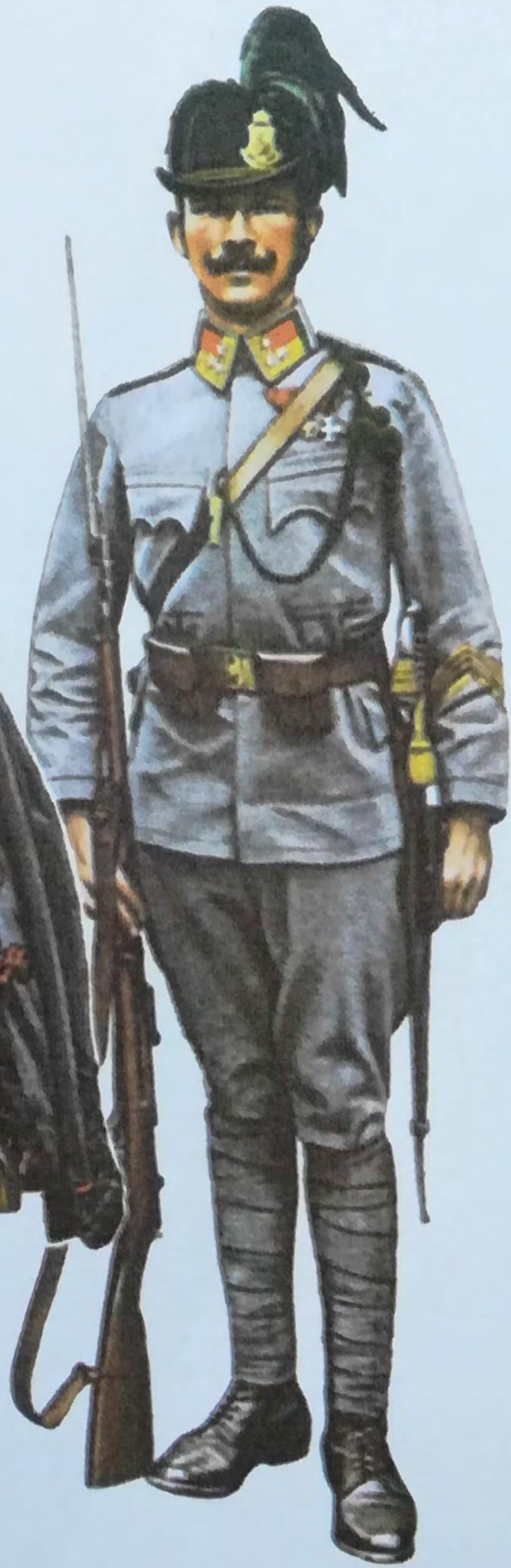
12 Gendarmerie n.c.o.