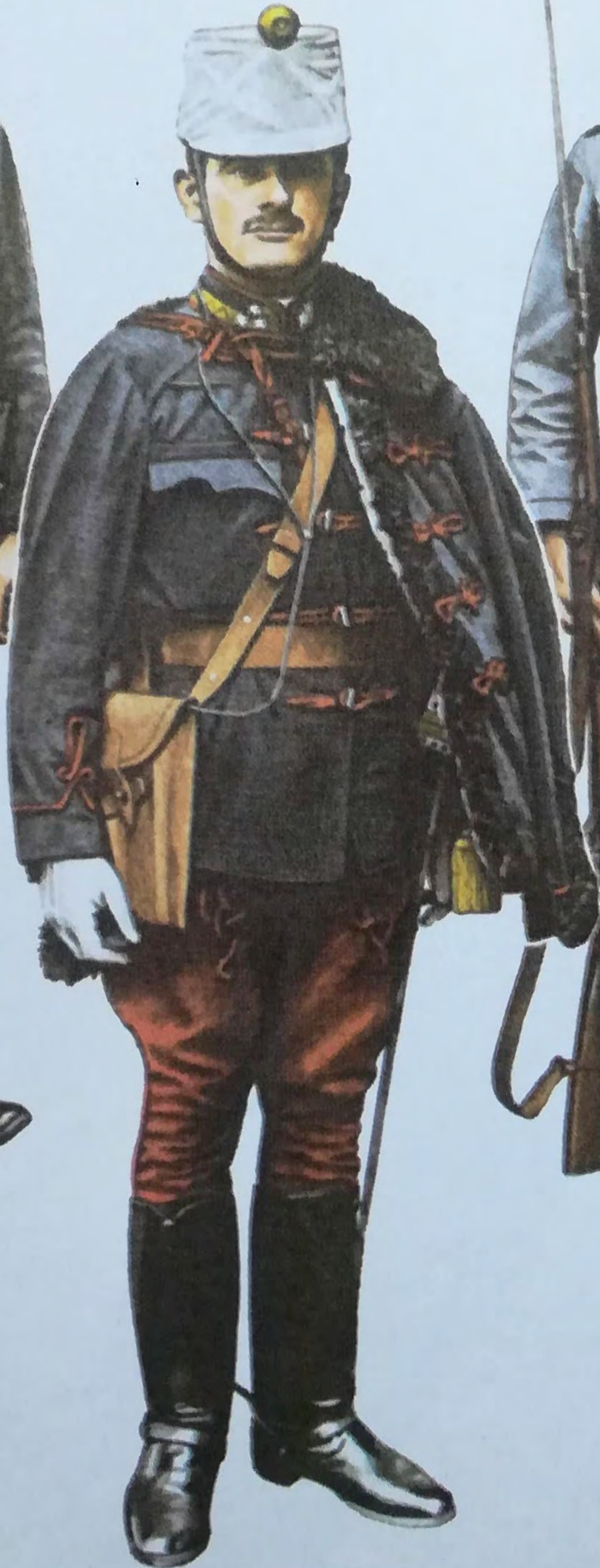
11 Hussar n.c.o.