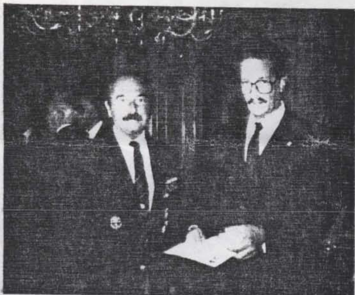
A Főkapitány úr a JDE-et átveszi.

Voltak, akik még az este folyamán elhagyták Bécset, de voltak, akik még maradtak továbbra is. A mi kis baráti csoportunk kellemes vacsora mellett a "atyás pincében búcsuzott el Bécstől s Ausztriától, hogy a felejthetetlen napokat jól emlékülke vessék.