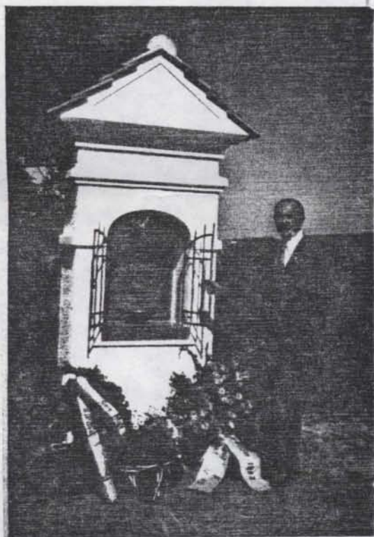
A Szt. Korona emlékmű.